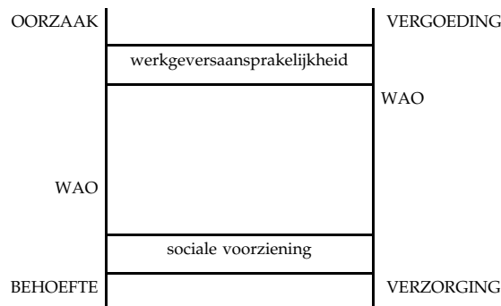
Figuur 7.2 Compensatieladder 1967

De toenemende kosten van de arbeidsongeschiktheidsverzekering waren vanaf ongeveer 1980 aanleiding voor verschillende ingrepen, die ik in hoofdstuk 6 beschreven heb (6.5). Het komt erop neer dat de toegankelijkheid van de WAO is ingeperkt. Maatregelen als een enger arbeidsongeschiktheidsbegrip en de strengere normering van de keuringspraktijk zorgen voor een stijging van de WAO op de poot van de rechtsgrond. De verlaging van de wettelijke uitkeringsniveaus, zorgt voor een daling aan de andere kant. De Nederlandse compensatieladder ziet er in de 21e eeuw dan ook sterk anders uit dan in 1967 (Figuur 7.3).