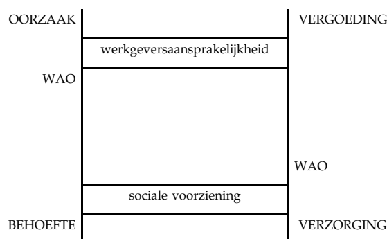
Figuur 7.3 Compensatieladder begin 21e eeuw

De WAO zit wat het vergoedingsniveau betreft inmiddels dicht in de buurt van een sociale voorziening op minimumniveau. Tegelijkertijd zijn de toegangs-criteria strenger geworden. Het in balans brengen van de WAO heeft een nieuw