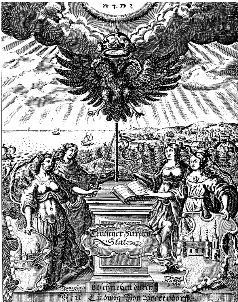
Illustratie 1: Allegorie van Von Seckendorff 2