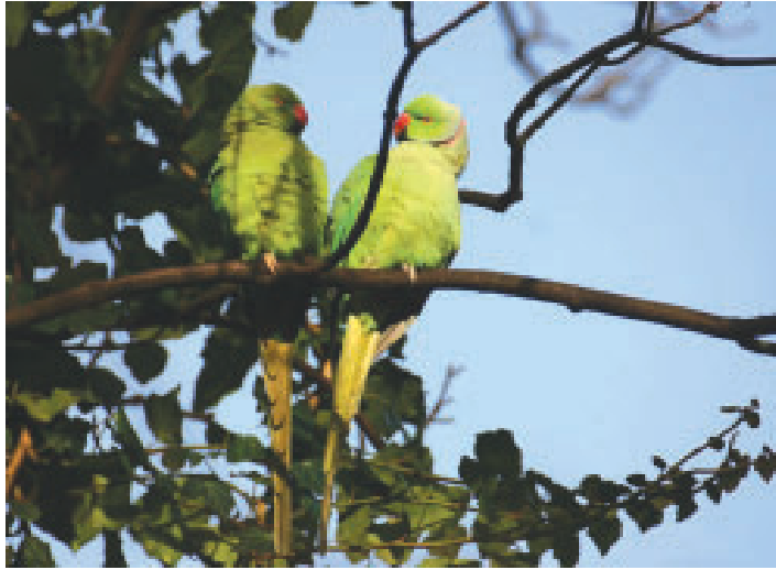
Een paartje Halsbandparkieten in het Ridderpark te Katwijk.

Er is in de literatuur gezocht naar gevallen van concurrentie tussen Nijlgans en inheemse vogelsoorten. Dit leverde een variabele lijst op van soorten waarmee de Nijlgans concurreert. Tussen 1982 en 2000 waren er 36 meldingen die betrekking hadden op achttien soorten. Daaronder waren achttien veldwaarnemingen. Tabel 1 geeft een overzicht van nestconcurrentie met onder andere roofvogels (met name Buizerd en Torenvalk) en Ooievaars en agressief gedrag tegenover soorten als de Bergeend en Zilvermeeuw. De lange lijst met soorten, aangevoerd door de Buizerd en Bergeend, hangt samen met het feit dat de Nijlgans niet kieskeurig is. De soort maakt gebruik van nesten van verschillende soorten. Als er op landelijke schaal wordt gekeken naar de trends in aantal broedparen van de concurrenten Bergeend en Buizerd, zou je een afname verwachten bij een toename van de Nijlgans. Dit is echter niet het geval. Eerdere lokale onderzoeken (Lensink & Van den Berk 1996, Van Dijk 2000, Lensink 1998b) konden ook geen negatieve invloed op inheemse soorten aantonen. Tijdens deze onderzoeken is onder andere gekeken naar trendvergelijkingen in het aantal broedparen (Lensink & Van den Berk 1996) en naar de invloed van het gebruik van roofvogelnesten door de Nijlgans op de stand van roofvogels (Van Dijk 2000). Samenvattend kan gesteld worden dat de Nijlgans in Nederland een sterke toename in aantal broedparen en verspreidingsgebied vertoont. Concurrentie met inheemse soorten