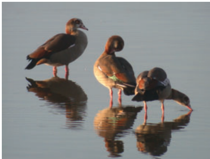
Drie Nijlganzen in het water op de Vogelplas Starrevaart.

Bergh, L. van den (1993): De Nijlgans, een avifaunistische aanwinst of een probleemvogel? Argus 18(2). Bijlsma, R. (1994): Nijlganzen op roofvogelnesten. De Takkeling 2 (3) (Zie ook : het Vogeljaar 42 (6): 277 Nijlganzen op stootvogelnesten.)