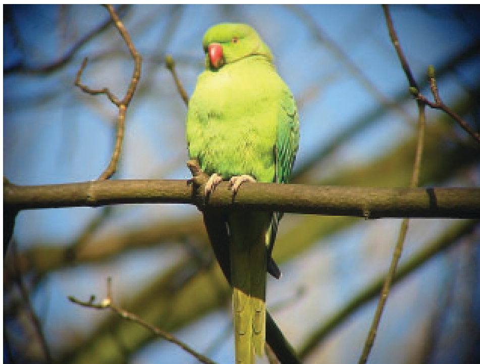
Een Halsbandparkiet rustend op een tak.