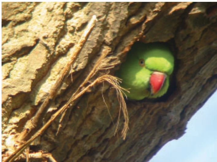
Halsbandparkieten zijn holenbroeders, die met name nestholten van de Grote Bonte Specht gebruiken.

Eén van de bekendste en talrijkste exoten in Nederland is de Nijlgans. Deze exoot broedde voor het eerst in Nederland in Scheveningen in 1967, na een ontsappingsgeval in Rijswijk (Teixeira 1979; Lever 1987). Daarna steeg het aantal broedparen exponentieel: 48 in 1977, 115 in 1983, 345 in 1989, 1350 in 1994 en 4500 à 5000 in 2000. Afname van de groei is in sommige gebieden inmiddels te zien (Lensink 1999, Sovon 2002). Vanuit het kerngebied rond Den Haag verspreidde de soort zich over de rest van het land. Ook het noorden kent een kerngebied: in 1981 ontsnapte in Groningen een aantal Nijlganzen, die zich vervolgens ook hebben verspreid (Sovon 2002, Lensink 1998a, 1998b). De voornaamste gebieden waar de soort voorkomt zijn West-Nederland en de gebieden langs de grote rivieren (met tien tot ruim vijftientig broedparen per 25 km 2 ).