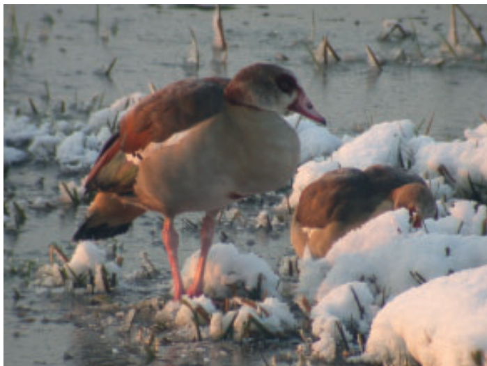
Twee Nijlganzen foeragerend in de sneeuw op de Vogelplas Starrevaart.