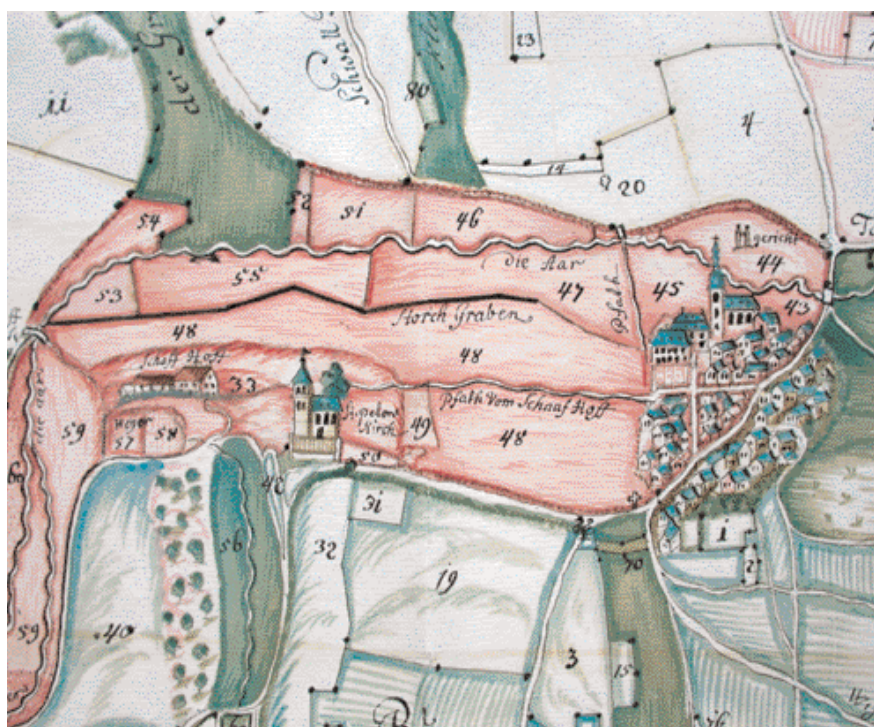
Fig. 5. Fragment van de overzichtskaart in het kaartboek van de goederen van St. Ferratium in Bleidenstatt, Andreas Trauttner, 1748.

Drie andere kaartboeken van Trauttner zijn tussen 1756 en 1768 vervaardigd in opdracht van de Grafen von Ostein. Twee van deze kaartboeken hebben betrekking op dezelfde onder Rüdesheim gelegen goederen en dateren uit dezelfde periode, respectievelijk 1767 en 1765-1768. Naast een luxe uitgevoerde exemplaar heeft Trauttner een kleiner, soberder uitgevoerd kaartboekje van dit grondbezit vervaardigd. De wijnbergen, met hun karakteristieke muurtjes, komen hierin goed naar voren (fig. 6).