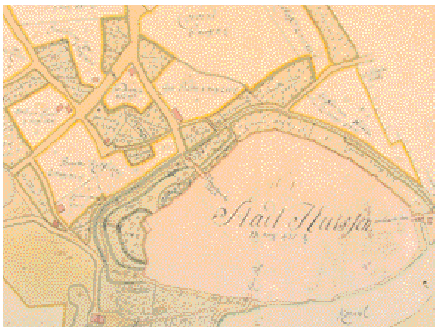
Fig. 4. Fragment uit het kaartboek van de Kleefse enclaves Huissen en Malburgen, [Guionneau], 1733.