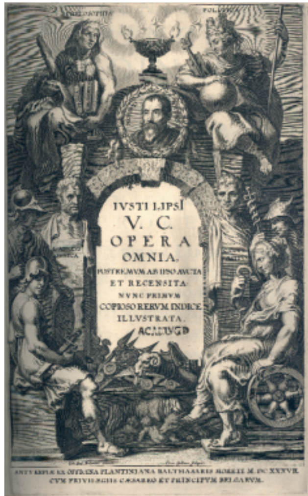
Cornelus Galle naar Petrus Paulus Rubens, Titelpagina van de Opera Omnia met het portret van Justus Lipsius in een lauwerkrans [139 A 6-9].

De afbeeldingen lieten op zich wachten en op het laatste nippertje vroeg Lipsius plots om cijfertjes aan te brengen op de kaart, die dan verwezen naar de bijhorende legende. Toch slaagde Johannes Moretus erin het werk tijdig en in