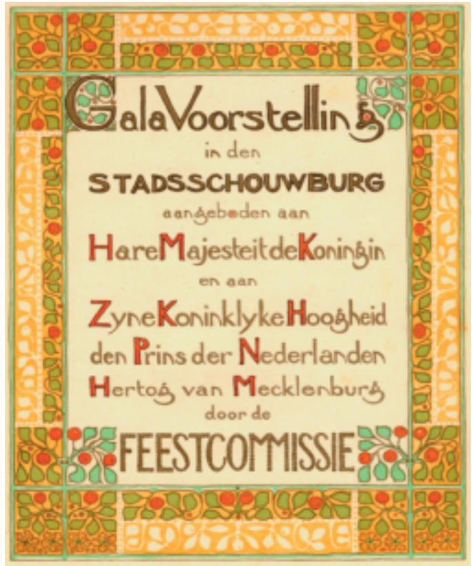
Programma Gala voorstelling 1901. Versiering door Th. Nieuwenhuis [22.422 C 6].

Nederlandse Letterkunde en is geplaatst in een van de gekluiste magazijnen van de Leidse bibliotheek. Dit is een zeer belangrijke collectie boeken, tijdschriften, documenten en efemer drukwerk betreffende het boek in de periode van de Nieuwe Kunst in Nederland. Toen de Maatschappij der Nederlandse Letterkunde de collectie in 1972 verwierf, was de inzet om 'in het bezit te komen van een groot aantal letterkundige uitgaven uit de periode van rond de eeuwwisseling, boeken die bovendien voor de kennis van culturele stromingen in Nederland onmisbaar zijn'. Bij de overdracht stond het Ernst Braches, de samenbrenger van de collectie, voor ogen dat de verzameling boeken die door hem in zijn proefschrift Het Boek als Nieuwe Kunst, 1892-1903 werd beschreven als het ware als bewijsvoering moest zijn voor toekomstige onderzoekers. Naast de zogenaamde kerncollectie omvat de verzameling een uit niet in het proefschrift beschreven deel dat bestaat uit dubbele exemplaren en bandvarianten van de in het proefschrift beschreven werken. Verder hebben de boeken uit de periode 1903 tot circa 1925 (de secundaire collectie, die dus niet is beschreven in Het boek als Nieuwe Kunst, 1892-1903 ) een aparte plek gekregen binnen de Collectie Nieuwe Kunst.