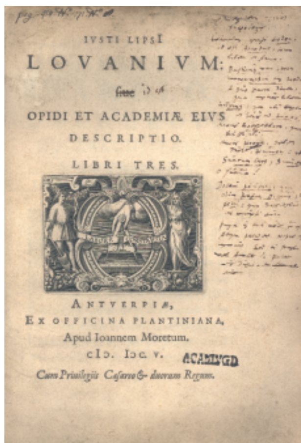
Titelpagina van Justus Lipsius, Lovanium [...]. Antwerpen, Ex Officina Plantiniana (1605), verbeterd met correcties voor de tweede druk. [765 B 20].

Dat het om haastwerk ging, blijkt uit het manuscript dat door de zetter werd gebruikt (Lips. 13). Het werd in 1722 als onderdeel van het zogenaamde Musaeum Lipsianum door Petrus Burmannus voor Leiden aangekocht op een veiling in Den Haag. Het bestaat uit twee ongenummerde