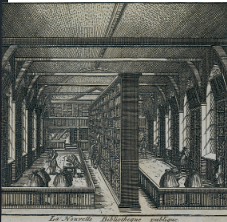
De Universiteitsbibliotheek van Leiden rond 1700. De bibliotheek werd in deze tijd fors uitgebreid door de aankoop van de Bibliotheca Vossiana.

Uit: Les delices de Leide [...]. Leiden, P. van der Aa 1712 [403 G 15]