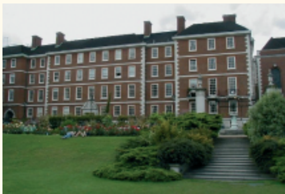
Inner Temple te Londen: de school van Sale