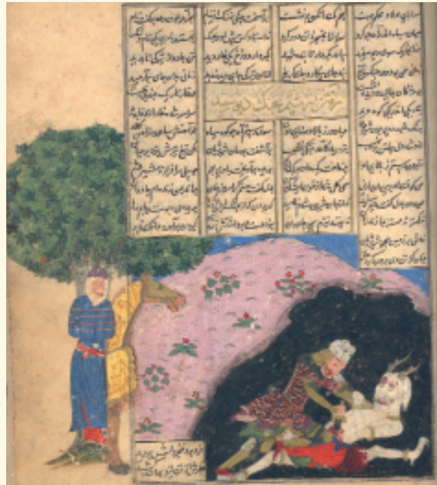
Shahnama (1437), Rustam verslaat de Witte Demon [Or. 494 f. 67r].

De vroegste geïllustreerde manuscripten van het Shahnama dateren uit het begin van de veertiende eeuw. Tot ver in de negentiende eeuw zijn er geïllustreerde handschriften vervaardigd. Een aanzienlijk aantal handschriften is bijzonder kostbaar en rijk versierd. Deze handschriften zijn in opdracht vervaardigd voor één van de Perzische sjahs, de Ottomaanse sultans of de Moghul-keizers van India. Iran heeft natuurlijk een groot aantal manuscripten, maar ook de British Library en het Topkapi Saray in Istanbul hebben belangrijke collecties. De UB van Leiden is in het bezit van een uniek Timuridisch Shahnama handschrift uit 1437 (Or. 494). Dit handschrift is in 1665 nagelaten aan de Universiteit door Levinus Warner, de Nederlandse resident in Istanbul. Warner heeft samen met de geleerden Scaliger en Golius de basis gelegd voor de rijke oosterse handschriftencollectie van de Leidse Universiteitsbibliotheek.