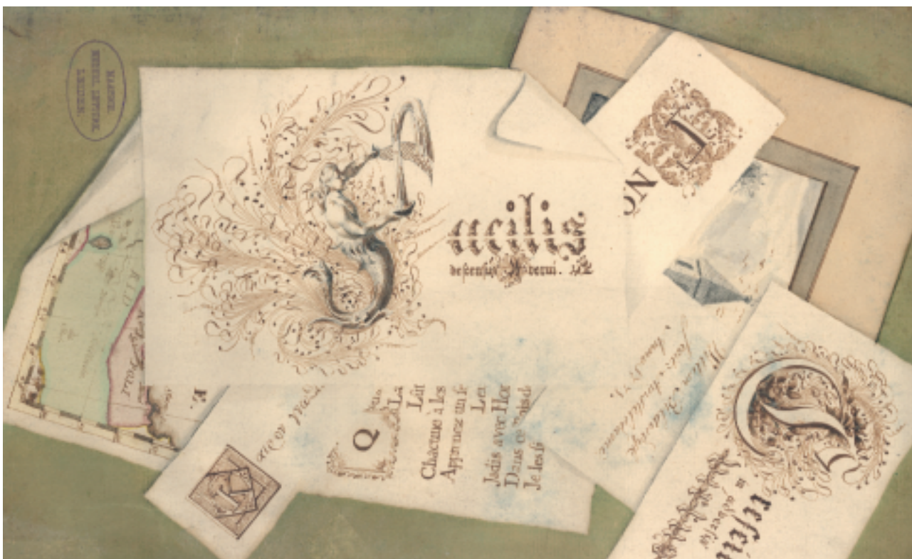
Willem Bilderdijk, een zogenaamde bedrieger met handschriften, tekeningen, drukken en prenten [Planol 1 a 1: 25].

In Bronnen van kennis wordt getracht te laten zien dat de collecties daarmee aan waarde hebben gewonnen. Vanuit nieuwe interesses zal de Leidse collectie een voortdurende bron van kennis blijken.