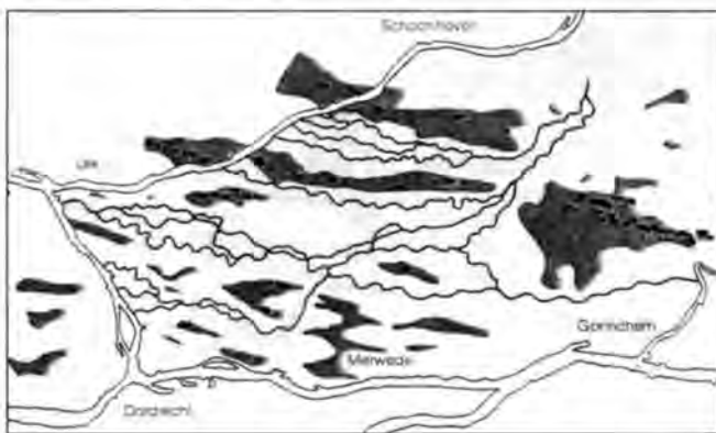
Een uitsnede van de laat-glaciale dalvlakte van Rijn en Maas in de ondergrond van de Alblasserwaard. In lichtgrijs de stroomvlaktes van de rivieren met daarin schetsmatig aangegeven de rivierlopen. Daartussen in grijs de rivierduinen waarvan de toppen nog als donken (zwart) boven de delta-afzettingen uitsteken.

De kampen zelf, zoals nu blijkt slechts in de wintermaanden bewoond, lagen op de hoogste delen, geconcentreerd op enige hectares. Het ligt voor de hand dat de hoogste donk