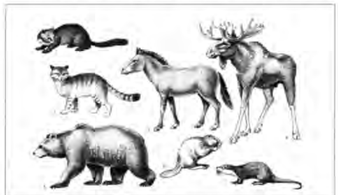
Enkele grote zoogdieren die vroeger de delta bevolkten, maar nu in Nederland niet of nauwelijks meer voorkomen.

Dan zijn er nog twee andere grote soorten waarop gejaagd werd: edelhert en wild zwijn. Mannelijke exemplaren van daarvan kunnen wel 150 tot 180 kg zwaar worden. Edelherkten zullen vooral de moerassen en geuldalen opgezocht hebben. Behalve voedsel en huid leveren mannelijke dieren ook gewei. Uit de opgraving te Hardinxveld weten we dat van dat gewei een heel scala aan gebruiksvoorwerpen gemaakt werd. Het gewei hoeft niet uitsluitend van gejaagde dieren afkomstig te zijn. Edelherkten werpen in het vroege voorjaar hun gewei af en het is heel goed denkbaar dat de donk-