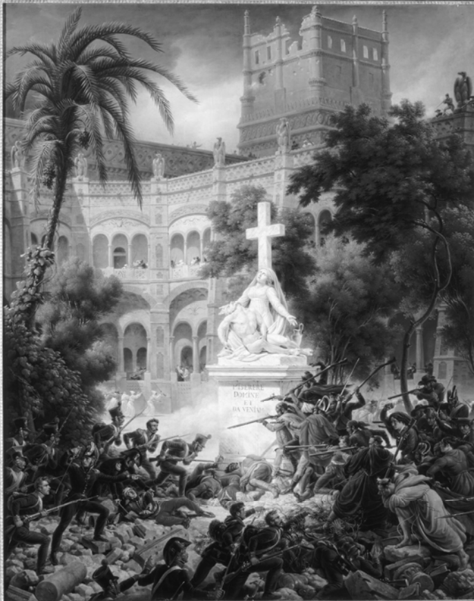
Afb. 2: L.F. Lejeune, ‘Anval op het klooster van San Engracia, Saragossa, 8 februari 1809’, 1827, olieverf op doek, collectie Musée national du château de Versailles.

maakte zich zorgen over iets, waar zijn voorgangers twintig jaar eerder geen woord aan hadden vuilgemaakt: de samenstelling van de troep. Napoleon had vele buitenlandse bondgenoten, maar die vochten in de meeste gevallen in eigen contingenten. In het Hollandse geval werden de voormalige Hollandse gebieden echter zelfstandige departementen en die departementen moesten hun ‘eigen’ regimenten vormen.