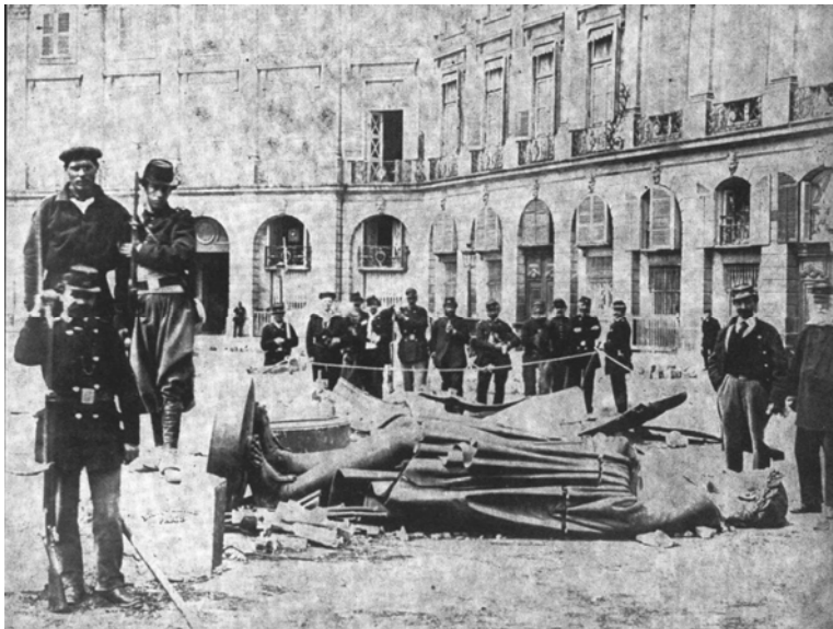
Afb. 2: Communards bij het omvergehaalde standbeeld van Napoleon op de place Vendôme.

Voor de jonge socialistische beweging was het netto resultaat van de Commune uitgesproken ambivalent. Natuurlijk was hier sprake van een verpletterende nederlaag die de Franse arbeidersbeweging voor jaren uiteensloeg. Woordvoerders, lokale organisatoren en zelfs de gewone aanhangers waren gesneuveld, gevangengezet, werden naar de strafkolonie Nieuw-Caledonië in de Stille Oceaan verbannen of gedwongen naar het buitenland te vluchten. Bovendien kwam het socialisme wereldwijd in een kwade reuk te staan doordat het de ‘misdaden van de Commune’ nog jarenlang voor de voeten geworpen kreeg.