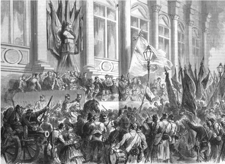
Afb. 3: De revolutie in uniform: na verkiezingen werd de Commune op 28 maart 1871 officieel uitgeroepen ten overstaan van circa 200.000 Nationale Gardisten.

en later het anarchisme optrad, toonde zich op dit terrein wel uitzonderlijk productief. Jaar na jaar, van 1880 tot zelfs ver in de Eerste Wereldoorlog, droeg hij zorg voor het in maart en mei bijna ritueel verschijnen van hoofdartikelen in Recht voor Allen en De Vrije Socialist onder titels als '18 maart 1871', 'Gedenk de Commune!', 'Maartoverdenkingen', 'Bloedige meidagen' of het pakkende 'Vergeet de heldendaden uwer voorgangers niet'. 25