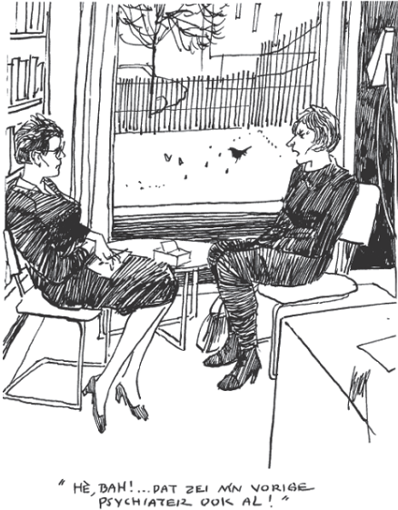
Figuur 3 Richtlijn in werking

Ondanks het probleem dat de aanbevolen behandelingen niet bij iedereen even goed werken, pleit ik er niet voor dat patiënten dan maar hun heil in het alternatieve circuit zoeken. Wat sommige alternatieve therapeuten beter doen dan de reguliere geestelijke gezondheidszorg is dat ze gemiddeld meer tijd en aandacht geven aan hun cliëntèle. En zoals hierboven uitgelegd is heeft dat een positief effect. Het nadeel is echter dat er soms veel geld moet worden neergeteld voor gebakken lucht. Patiënten kunnen niet beoordelen of de voorgestelde behandeling kwaad kan – baat het niet, dan kan het wel schaden.