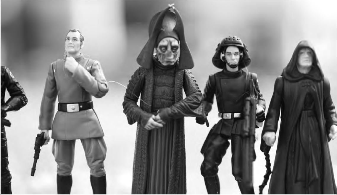
Jediriddarna ikläder sig en eftersträvsvärd superhjälteroll, och det är en av anledningarna till att det har uppstått en religiös rörelse med avstamp i Star Wars.

Wars medans det inte är troligt att något liknande kommer att hända med andra populära science fiction- och fantasyberättelser som Avatar eller Harry Potter . Man kan peka på åtminstone två skäl. För det första tangerar föreställningen om Kraften i Star Wars med den vaga föreställning som de flesta moderna västerlänningar har om att det finns en högre makt av en eller annan art (men inte en personlig gud). För människor som redan tror på en sådan högre makt krävs det ingen omvändning för att bli jediist. Det kostar så att säga inte något. Men man får något tillbaka, och det är den andra anledningen till att det har utvecklats en religion just utifrån berättelsen Star Wars . För människor som inte har en tydlig religiös tillhörighet, men tror på en högre makt och kanske är intresserade av olika former av religion och andlighet, är Jedi en attraktiv religiös identitet. Jediriddarna är tillräckligt mänskliga för att för att man ska kunna identifiera sig med dem, men samtidigt eftersträvsvärda förebilder. Jediidentiteten är stark och suggestiv, men även flytande nog för att kunna integrera element från traditioner utanför Star Wars . Slutligen förenar jedirollen en allmän social etik om att kämpa för det goda och hjälpa de svaga med ett självutvecklingsideal. Med andra ord förser jediismen vissa gemensamma värderingar (man ska göra sitt bästa, och man ska hjälpa sin nästa) och en lika