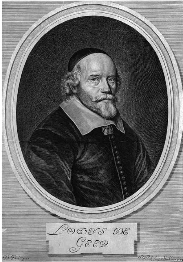
Gravure van Louis de Geer (1587-1652) gemaakt door Jeremias Falck.

twee keer, met Nederlandse vrouwen van adel, waardoor hij zich heer van verschillende gebieden in de provincie Utrecht mocht noemen. Hij was tevens kanunnik van St. Marie in Utrecht.