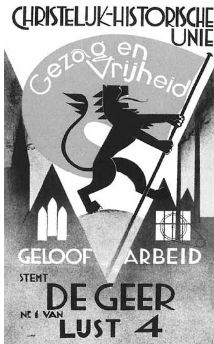
Verkiezingsaffiche uit 1933.