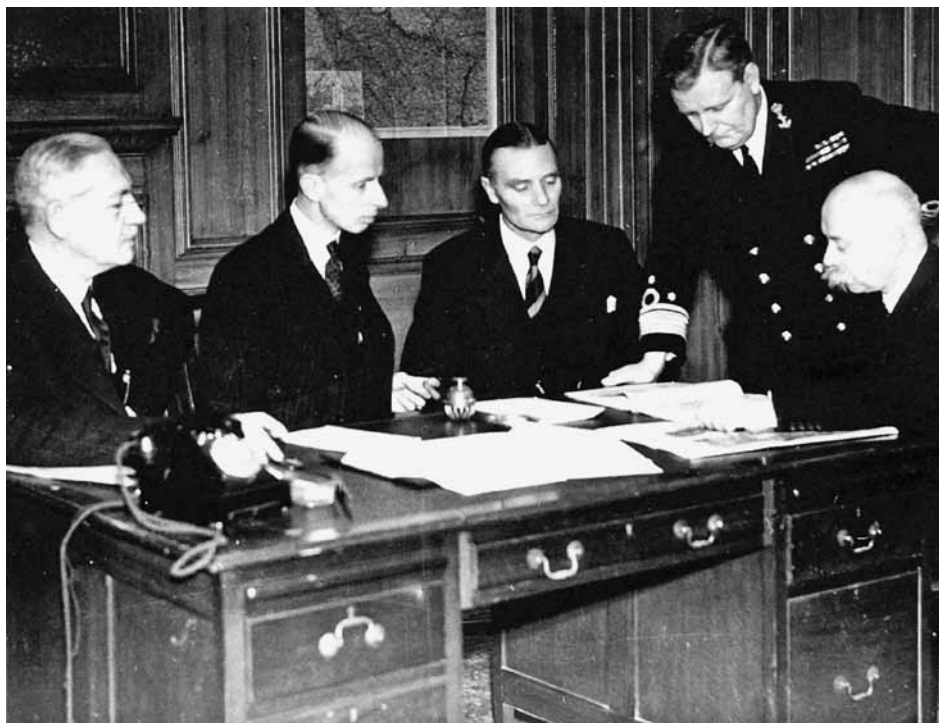
Kabinetsoverleg in oktober 1940, na het vertrek van De Geer als minister-president. Vlnr: Welter, Van Kleffens, Dijkhoorn, admiraal Furstner en Gerbrandy.

Van Lidth de Jeude de ministers 'die met sombere gezichten thee zitten te drinken'. "Jhr. de Geer doet zeer verrukt dat hij mij ziet en beklagt zich dat hij zijn vrouw niet kan laten weten dat hij bericht heeft ontvangen uit Nederlands-Indië, dat daar een kleindochter is geboren. Het schijnt wel de belangrijkste gedachte die hem bezig houdt." Nu had De Geer zeker andere dingen aan zijn hoofd. Het kabinet moest de eerste dagen vergaderen in een leegstaande slaapkamer of soms in de lobby van het hotel, in het bijzijn van andere gasten.