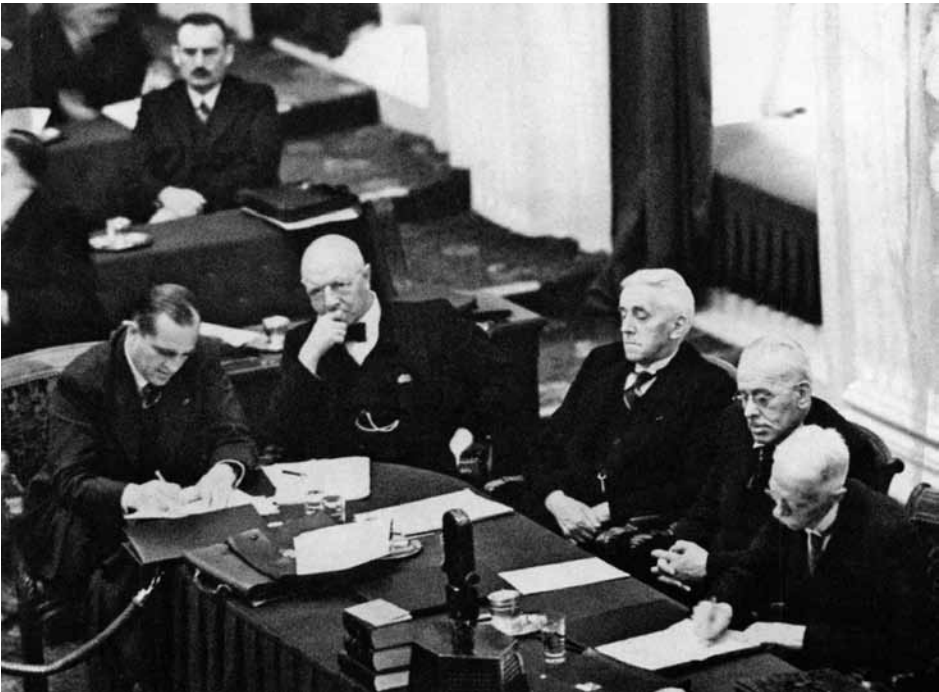
Begin van begrotingsdebatten in oktober 1939 in de Tweede Kamer. Achter de regeringstafel, vlnr.: Steenberghe, Albarda, Bolkestein, Van Boeijen, De Geer. In het kamerbankje bovenaan zit Willem Drees.