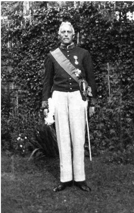
De Geer poseert in uniform, klaar voor Prinsjesdag 1939.

De Geer vond het morrelen aan de huwelijksinstelling een ‘aanslag op onze beschaving’. 29 Zijn stelling was dat een onbeperkte scheidingsmogelijkheid ongelukkige hu-