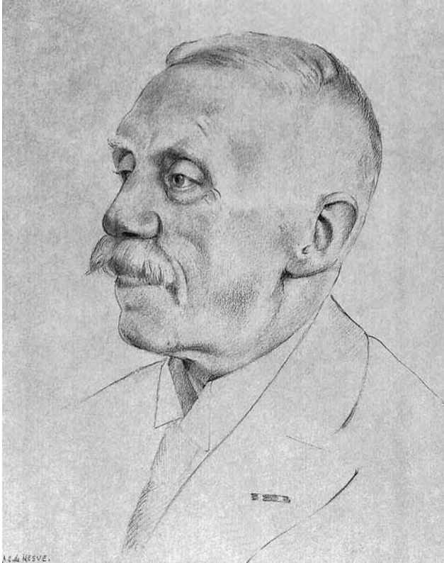
C.A. de Neeve tekende in opdracht van het ministerie van justitie in 1950 portretten van alle ministers die op dat ministerie hadden gediend. Belasting en Douane Museum.

von Zech von Burkersroda, die lange tijd Duits gezant was in Den Haag en De Geer persoonlijk kende, was zijn neef met wie hij regelmatig contact had. 26 Huene was in 1934 in Portugal als gezant gekomen en bleef dat tot 1944. Hij werd toen vervroegd gepensioneerd en volgens hemzelf was dat het gevolg van een ‘zuiveringsactie’ na de aanslag in 1944 op Hitler. 27