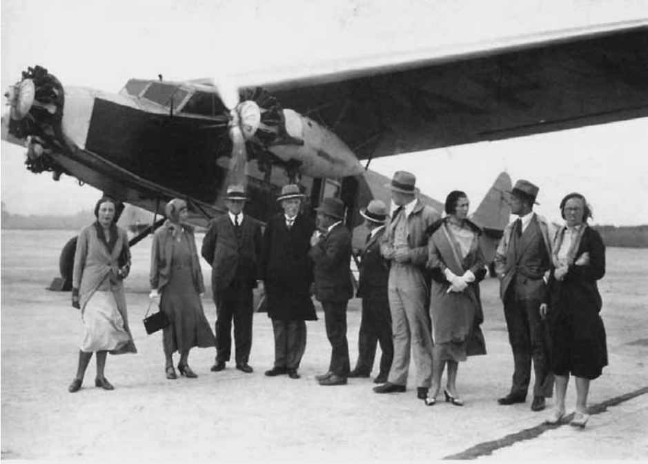
De Geer (vierde van links) ging op 30 juli 1931 voor het eerst vliegen. Hij is daarvoor uitgenodigd door KLM-directeur Albert Plesman.

sluiten van belastingkantoren weer een stap in de richting was van een niet-gewenste centralisatie. Het ontnam belastingbetalers de mogelijkheid om over hun aanslag te overleggen. Maar het belangrijkste was volgens Oud het privacyelement. Mensen wilden niet dat de plaatselijke postambtenaar te weten kwam hoeveel zij moesten betalen en dus kon schatten hoeveel inkomsten zij hadden. 78 Daarop stelde De Geer voor om de mogelijkheid om op postkantoren te betalen te beperken tot de steden en de kantoren op het platteland open te houden. Dit accepteerde de Kamer. Oud was nog steeds kwaad over de beschuldiging van De Geer dat de opposanten conservatief waren. Toen hij hoorde hoe De Geer bijdraaide, viel hij de minister in de rede. Met ironie prees hij De Geer dat hij eens naar de Kamer wilde luisteren. “Het is wel eens aangenaam in deze minister ook deze eigenschap een keer te kunnen ontdekken. Als hij zo gemakkelijk overstag gaat, had hij toch een andere toon moeten voeren dan hij gevoerd heeft.”