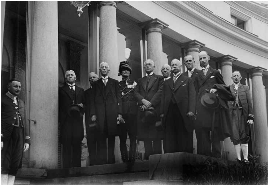
Het tweede kabinet van De Geer is net beëdigd door koningin Wilhelmina op Paleis Soestdijk op 10 augustus 1939. Vlnr: Bolkestein, Van den Tempel, De Geer, Dijkhoorn, Welter, Albarda, Gerbrandy, Steenberghé en Van Kleffens. Van Boeijen ontbreekt om onbekende reden.

Van Kleffens twijfelde of hij het aanbod zou accepteren. Hij voelde er niets voor om de politiek in te gaan. “Er stond een oorlog voor de deur waarin het departement een rol zou spelen als nooit tevoren – moest ik nu werkelijk dáárvoor de vervulling van een grote wens opgeven?” Het feit dat de koningin graag had gezien dat hij de functie accepteerde,