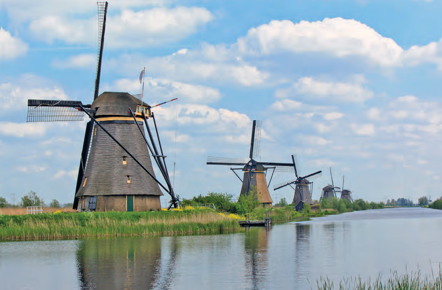
Afb. 2 Achtkante bovenkruiers aan de Overwaard bij Kinderdijk. Molens nemen sinds lange tijd een belangrijke plaats in binnen de erfgoed- en monumentenzorg in de provincie Zuid-Holland. Het molencomplex bij Kinderdijk staat sinds 1997 op de werelderfgoedlijst van Unesco.

Hoewel er door heel Nederland interessante ontwikkelingen plaatsvinden, richt Tijdschrift Holland zich in dit nummer vooral op de provincie Zuid-Holland en het zogeheten 'Erfgoedlijnenbeleid' dat daar recentelijk is ontwikkeld. Een Erfgoedlijn is een geografische structuur die meerdere monumentale 'stippen' (locaties) met één gemeenschappelijk verhaal verbindt tot één streep of lijn op de kaart. De Erfgoedlijnen zijn voorts, in de woorden van de provincie: 'ensembles van erfgoed, landschap en water die kwaliteit verschaffen aan de ruimte en beschikken over groot recreatief en toeristisch potentieel.'