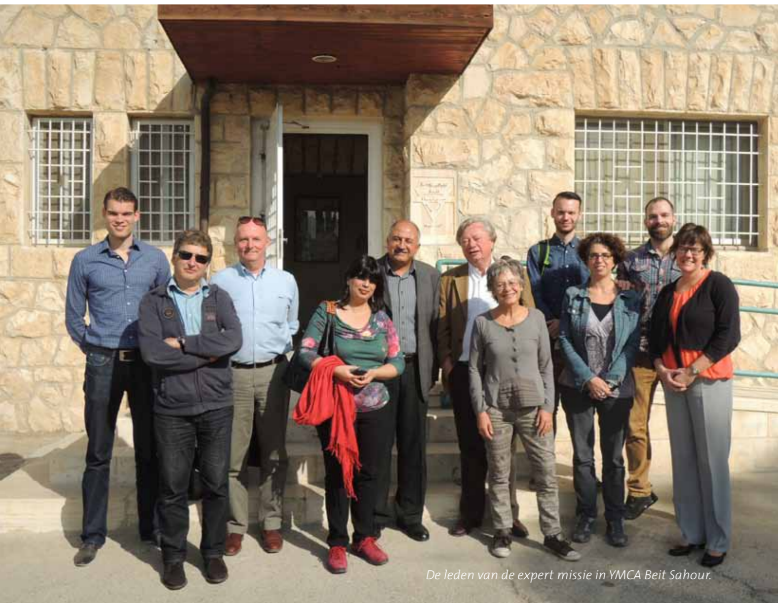
De leden van de expert missie in YMCA Beit Sahour.