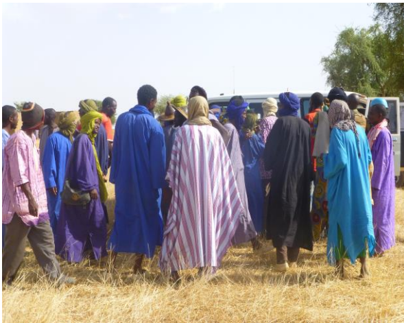
Participants au forum de Dewral Pulaaku au campement peul de Serma (Douentza). @B. Sangaré, octobre 2014.

Considéré jadis comme un modèle démocratique, le Mali connaît depuis 2012 une crise politico-sécuritaire sans précédent. Bien que la crise malienne ait parfois été qualifiée par bon nombre d'analystes comme la « crise du nord Mali », elle s'étend actuellement sur tout le territoire national et connaît des mutations d'ordre social, religieux, territorial etc. Déclenché par le Mouvement national de libération de l'Azawad (MNLA), visant la constitution d'une entité territoriale touareg dans le nord du pays, le conflit malien a été animé, de 2012 à nos jours, par une diversité d'acteurs, dont des djihadistes, des narcotrafiquants, des individus à la