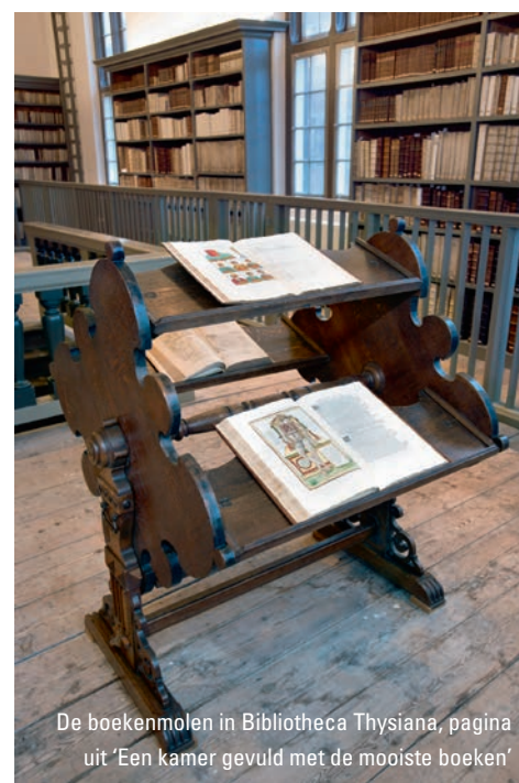
De boekenmolens in Bibliotheca Thysiana, pagina uit 'Een kamer gevuld met de mooiste boeken'