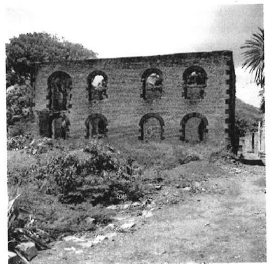
Ruïne van de synagoge, St. Eustatius