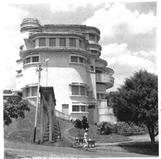
Villa Isola (Bandung)