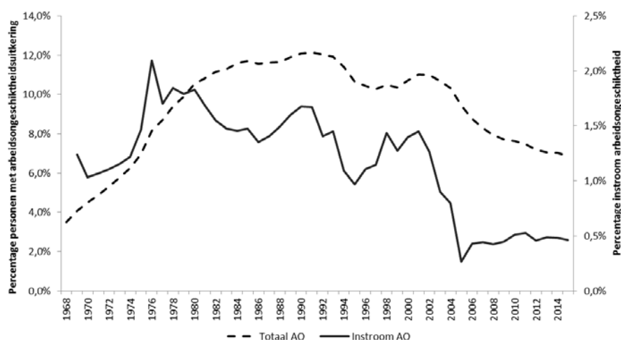
Figuur 1 Aandeel personen met een arbeidsongeschiktheidsuitkering en instroom in de arbeidsongeschiktheid in de beroepsbevolking, 1968-2015