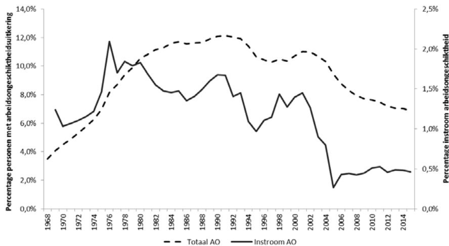
Figuur 1 Aandeel personen met een arbeidsongeschiktheidsuitkering en instroom in de arbeidsongeschiktheid in de beroepsbevolking, 1968-2015