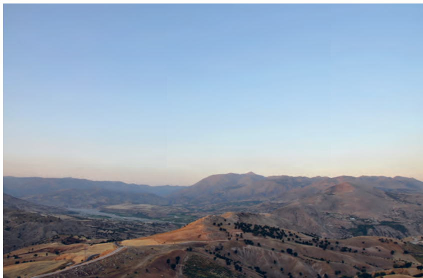
Afb. 1: Gezicht op het Taurusgebergte vanuit de Kommageense laagvlakte. De opvallende tumulus van Nemrud Dağ is duidelijk herkenbaar door de deels artificiële vorm.

Verborgen op grote hoogte in het Taurusgebergte ligt een van Turkijes belangrijkste en meest fascinerende archeologische monumenten: Nemrud Dağ (zie afb. 1). Omstreeks 50 v.Chr. bouwde een zekere Antiochos I, de lokale vorst van een klein koninkrijk genaamd Kommagene, hier een imposante tempel-tombe die in ontwerp en uitvoering getuigt van een groot aantal (culturele) invloeden uit heel Eurazië. Nederlands onderzoek op de berg zelf en op andere sites in het gebied, zoals de antieke hoofdstad Samosata, heeft laten zien dat Kommagene in de Hellenistisch-Romeinse periode een belangrijk kosmopolitisch knooppunt was. Hoe kunnen we dat verklaren? En wat voor rol kan het kosmopolitische karakter van het antieke Kommagene spelen in debatten over identiteit, toen en nu?