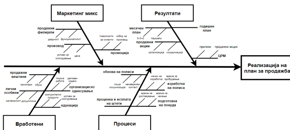
Фигура 5. Причинско-последична анализа на проблемите во компанијата или Ишикава дијаграм