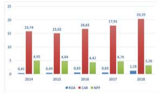
Gambar 2. Persentase laba (ROA), CAR, dan NPF (dalam persen)

dilakukan untuk mengukur dan meninjau risiko pembiayaan bermasalah agar dapat mengantisipasi kerugian yang kemungkinan terjadi (Iskandar & Laila,