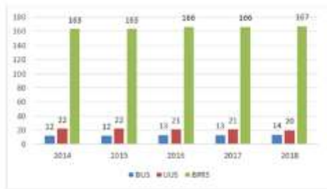
Gambar 1. Perkembangan jumlah lembaga keuangan syariah di Indonesia

Perkembangan jumlah Bank Umum Syariah (BUS) di Indonesia terus meningkat hingga saat ini terdapat 14 BUS yang terdaftar di Otoritas Jasa Keuangan (OJK). Bank syariah dapat dikategorikan sebagai jenis industri yang mempunyai daya tarik tinggi terhadap masyarakat, selain untuk menghindari riba yang tidak sesuai dengan prinsip syariah masyarakat juga ingin memperoleh keuntungan dari tabungan dengan sistem yang digunakan oleh bank syariah yaitu bagi hasil.