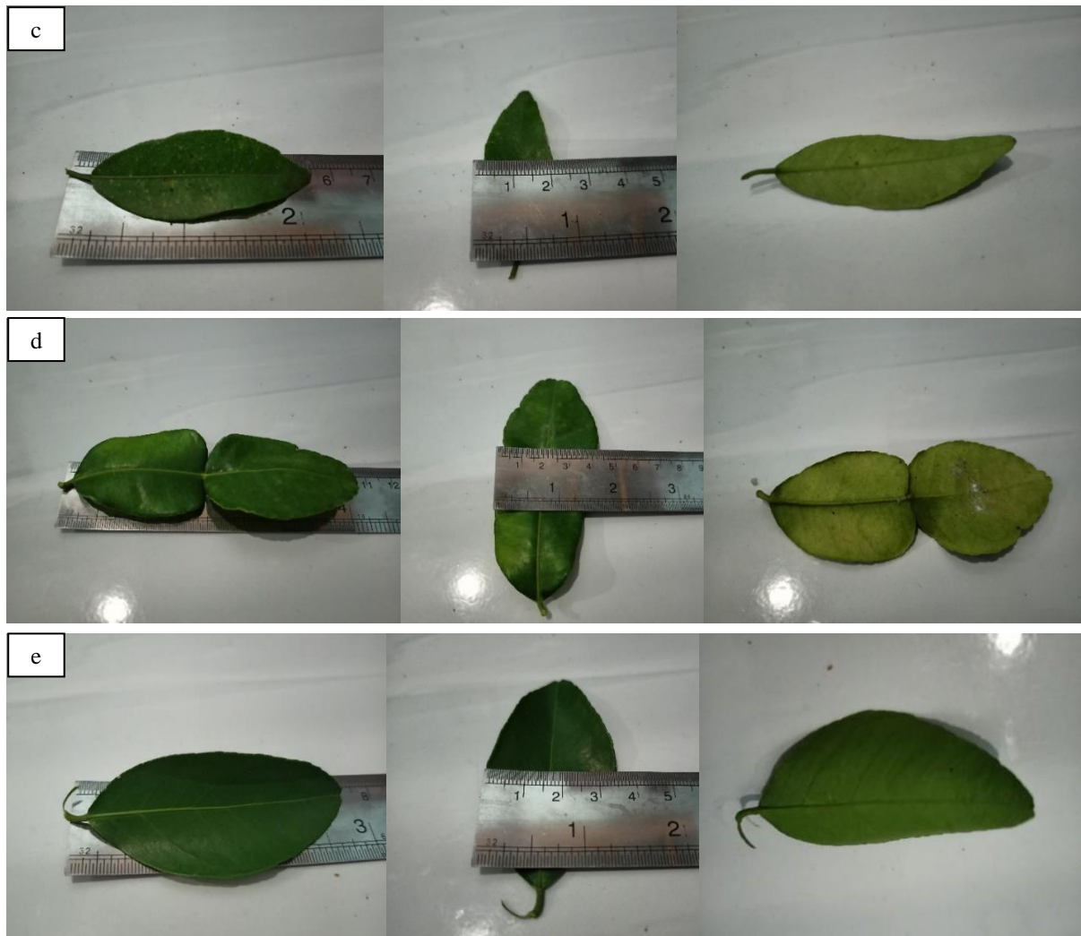
Gambar 2. a) Daun jeruk bali, b) Daun jeruk nipis, c) Daun jeruk keprok, d) Daun jeruk purut, e) Daun jeruk sunkist hijau