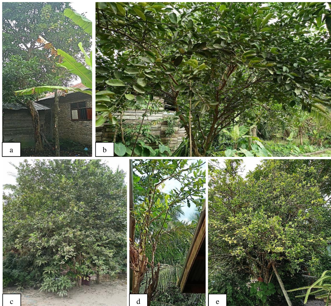
Gambar 1. a) Pohon jeruk bali, b) Pohon jeruk nipis, c) Pohon jeruk keprok, d) Pohon jeruk purut, e) Pohon jeruk sunkist hijau

Pada Kecamatan Nibung Hangus, Kabupaten Batu Bara, ada 5 jenis tanaman jeruk yang dijumpai yaitu jeruk bali ( Citrus maxima ), jeruk nipis ( Citrus aurantifolia ), jeruk keprok ( Citrus reticulata blanco ), jeruk purut ( Citrus hystrix ), dan jeruk sunkist hijau ( Citrus sinensis ) seperti yang terlihat pada Gambar 1. Tanaman jeruk nipis ( Citrus aurantifolia ) merupakan jenis tanaman jeruk yang banyak dijumpai di lokasi penelitian. Hal itu dikarenakan buah jeruk nipis ( Citrus aurantifolia ) sering digunakan dalam bahan masakan, seperti menambah rasa segar pada sambal, menetralkan bau amis, dan membuat minuman segar.