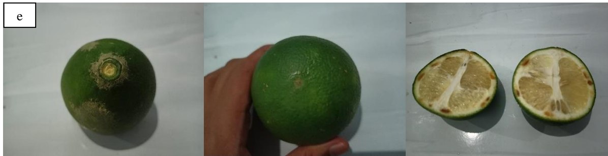
Gambar 3. a) Buah jeruk bali, b) Buah jeruk nipis, c) Buah jeruk keprok, d) Buah jeruk purut, e) Buah jeruk sunkist hijau