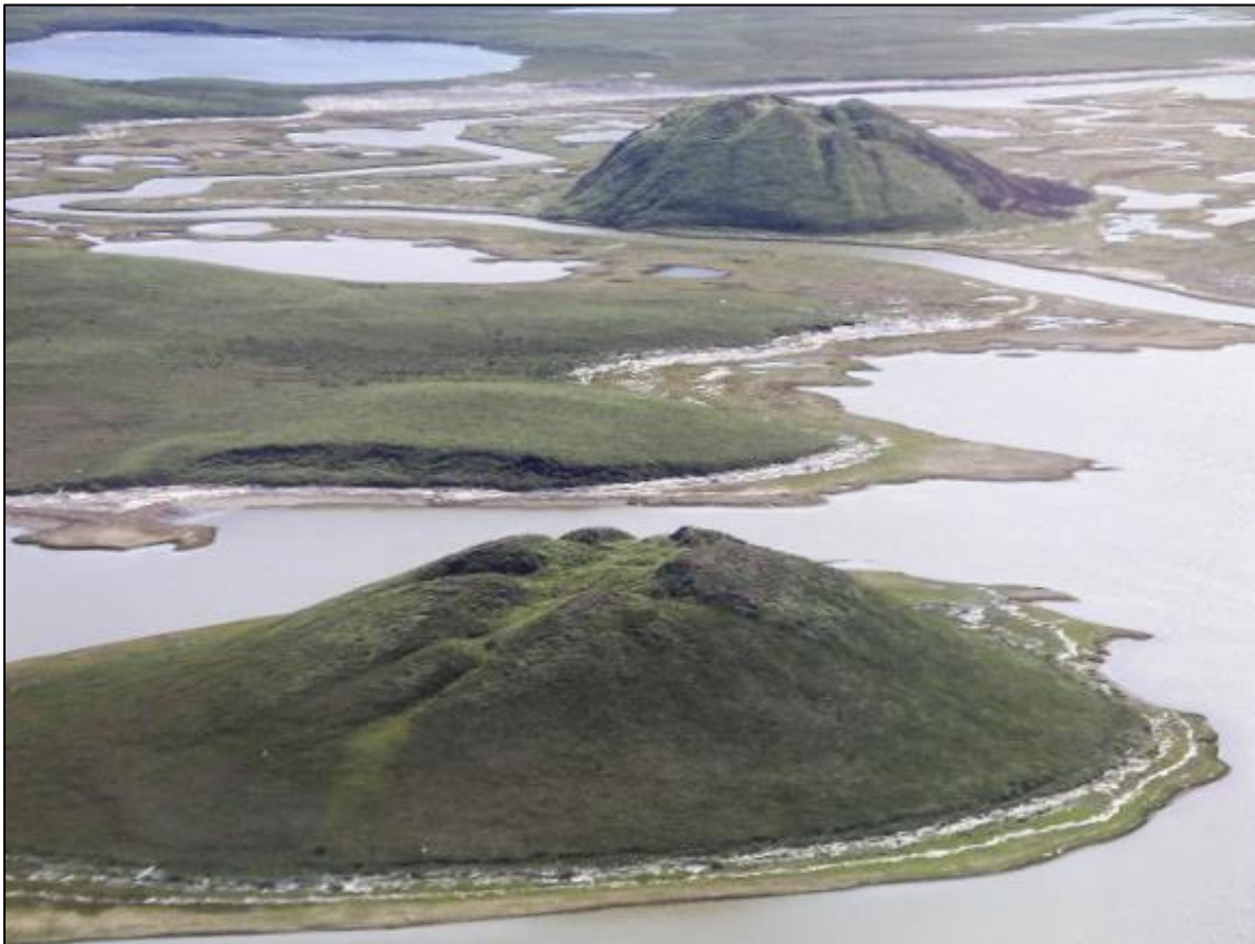
Figuur 2. Twee pingo's in de Mackenzie-rivier in Alaska. De geologische situatie in de laatste ijstijd leek sterk op die in het huidige Alaska – de geologische processen die toentertijd in Noord-Nederland leidden tot de vorming van pingo's leiden nu tot de vorming van pingo's in Alaska.

In het huidige landschap zijn pingoruïnes vaak herkenbaar als ronde depressies, maar niet alle ronde depressies zijn pingoruïnes. Op geologische kaarten in Nederland wordt gesproken van dobben als samenvattende term voor deze depressies. Alleen met veldwerk (grondboringen) kan vastgesteld worden of een dobbe een pingoruïne is. Deze laat zich herkennen door de relatief grote dikte van de organische vulling (zie ook Verbers et al. 2018).