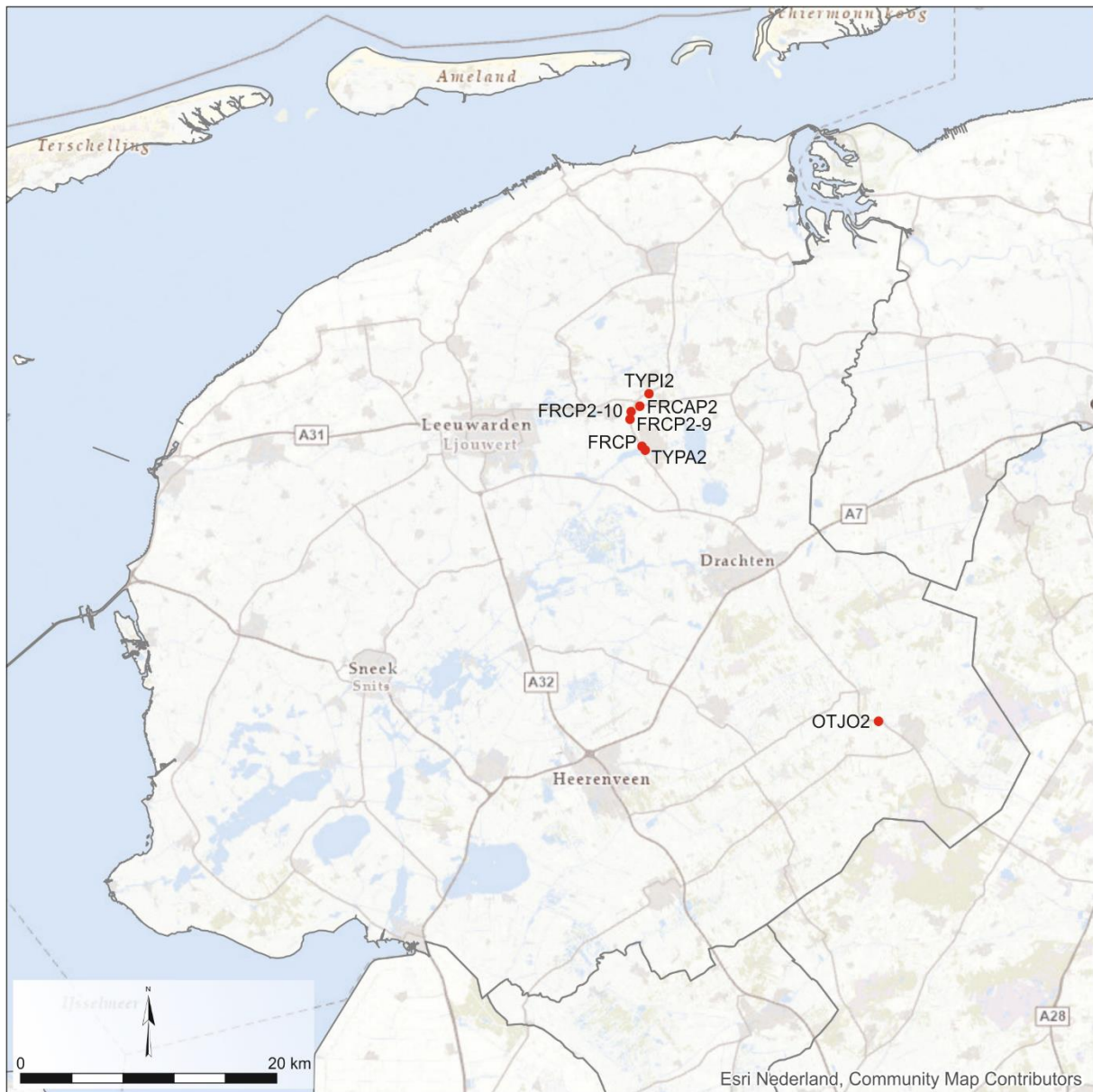
Figuur 1. De ligging van de onderzochte pingoruïnes (figuur E. Bolhuis, GIA).