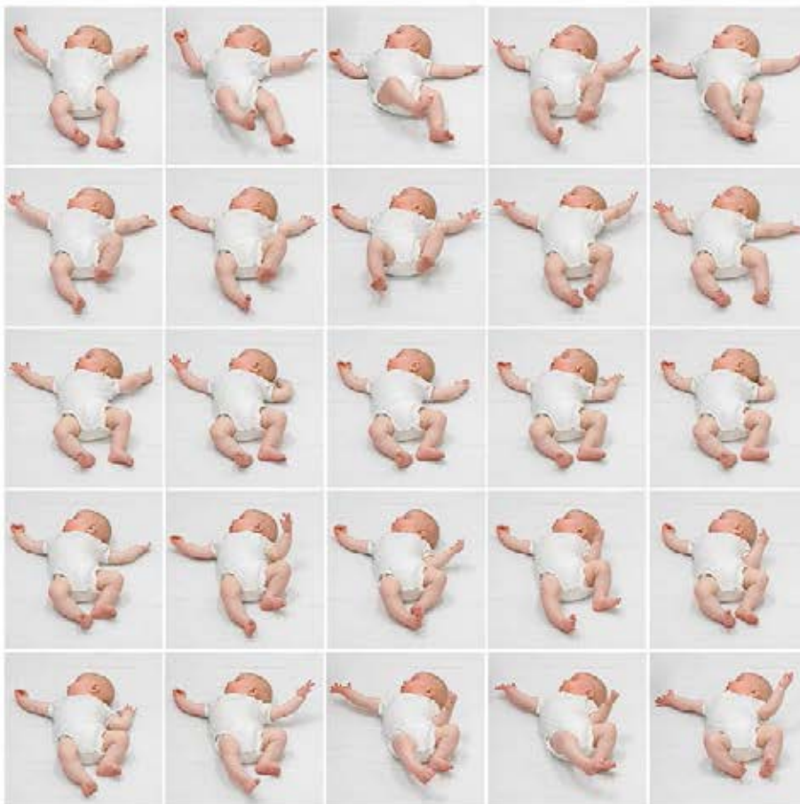
Illustration 2: Comportement spontané en matière de mouvement au 3 e mois (âge corrigé). En haut: schémas typiques, mouvements globaux normaux. En bas: stéréotypie, mouvements globaux nettement anormaux.