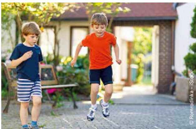
Frühe Interventionen verbessern die Entwicklungsprognosen. | Les interventions précoces améliorent le pronostic de développement.

Dans les pays industrialisés, 15 à 20% des enfants en âge préscolaire ont un retard de développement isolé, 1 à 3% ont un retard de développement combiné dans les domaines de la motricité/cooordination, des organes sensoriels, de la cognition, du langage, de l'apprentissage, du psychisme et du comportement [1]. Les enfants qui ont présenté des complications prénatales et périnatales, comme les bébés prématurés d'un poids inférieur à 1500 g à la naissance, ont un risque encore plus élevé de troubles du développement (25 à 50%), d'infirmité motrice cérébrale (5 à 10%) et d'intelligence réduite. Mais seuls 3% des enfants bénéficient de mesures de soutien au cours de leurs cinq premières années; ce n'est qu'à l'âge scolaire que cette part passe à 12,5% [2]. Un temps précieux est donc perdu car les interventions précoces améliorent le pronostic de développement [3]. La détection précoce est dès lors indispensable.