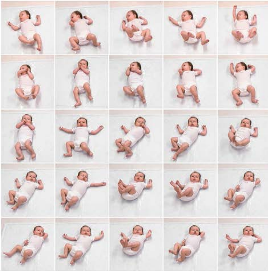
Abbildung 2: Spontanes Bewegungsverhalten im Alter von 3 Monaten (korrigiertes Alter KA). Oben: typische Muster, normale «General Movements». Unten: Stereotypien, deutlich abnorme «General Movements».