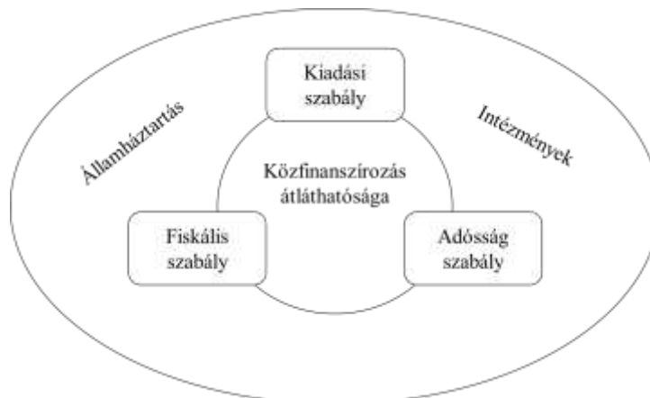
1. ábra A költségvetés felelősségi szabályainak négy pillére Csehországban