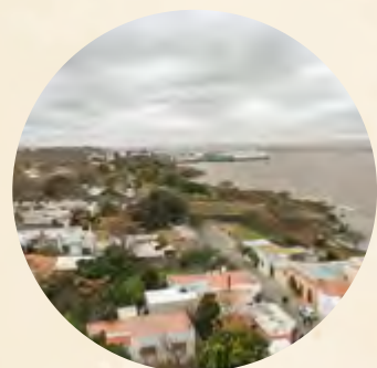
Pie de foto / Caption