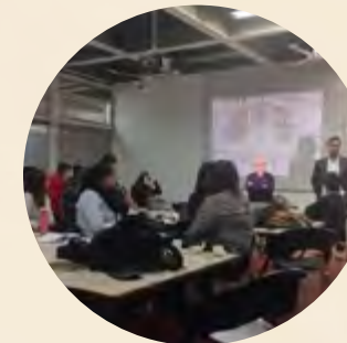
Pie de foto / Caption