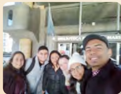
Pie de foto / Caption