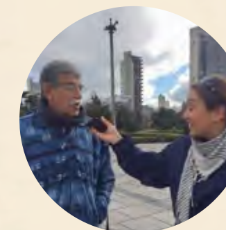
Pie de foto / Caption