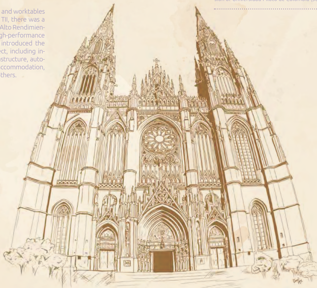
Ilustración de la Catedral "Nuestra Señora de los Dolores" La Plata, Argentina, por Daniela Martínez Díaz.

In addition to lectures and worktables during Phase I of the TII, there was a field trip to Centro de Alto Rendimiento de Bogotá, a high-performance sports facility, which introduced the students to the subject, including information about infrastructure, automation processes, accommodation, and training, among others.