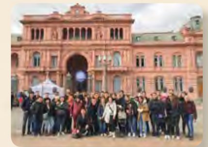
Pie de foto / Caption