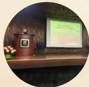
Pie de foto / Caption

Illustration of Nuestra Señora de los Dolores Cathedral, in La Plata, Argentina. By: Daniela Martínez Díaz.