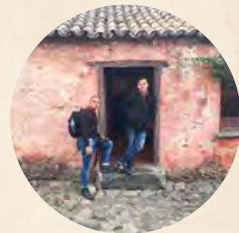
Pie de foto / Caption