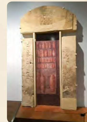
Pie de foto / Caption