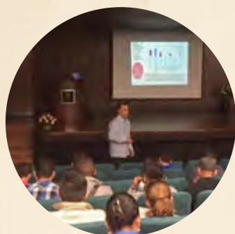
Pie de foto / Caption