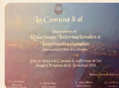
Pie de foto / Caption

Universidad Piloto de Colombia feels very proud of the DRRII for having received a certificate from the Board and the President of Comuna 8, – intervention zone of the XXIV International Interdisciplinary Workshop "Argentina: Territory and Sport" – awarded during the visit of the students to the area.