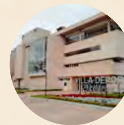
Pie de foto / Caption

Centro de Alto Rendimiento – Coldeportes.