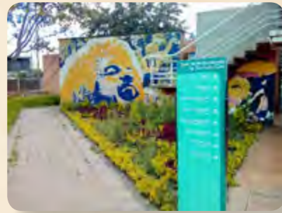
Pie de foto / Caption

Centro de Alto Rendimiento – Coldeportes.