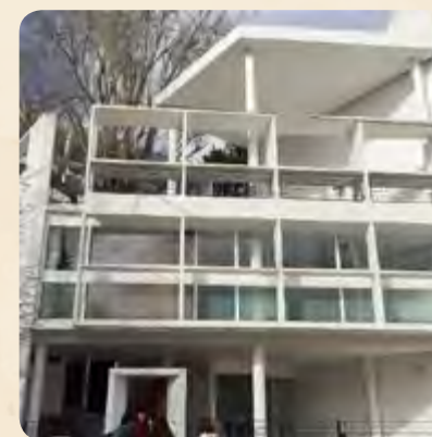
Pie de foto / Caption

During the visit to the city of La Plata, students toured the most representative places of the city, the Museum of Natural History and Casa Curutchet, designed by the master of Architecture, Le Corbusier.