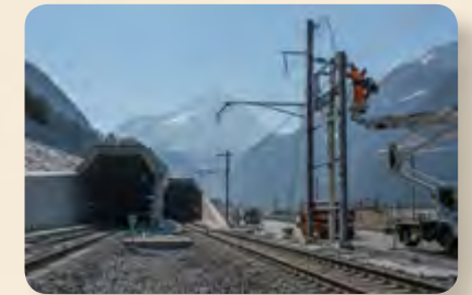
Pie de foto / Caption

The lecture and the exhibition are the result of the relations built by the DRRII with strategic partners, which have enabled it to conduct cooperation activities that make an impact on the internationalization of the UPC's substantive functions. The exhibition was a local internationalization activity that allowed the UPC community to have access to knowledge from the globalized world, which contributes to the comprehensive education of the students and has impact on social outreach.