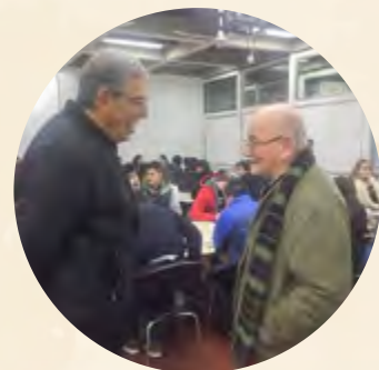
Pie de foto / Caption