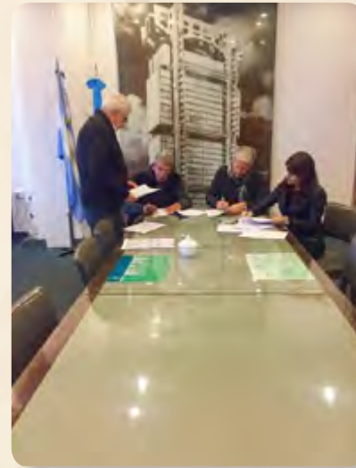
Pie de foto / Caption