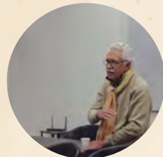
Pie de foto / Caption

Additionally, students traveled to the cities of Colonia in Uruguay and La Plata, known for the richness of their historical architecture.