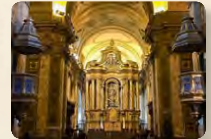
Pie de foto / Caption

The city tour was the first contact of students with the city of Buenos Aires, where they visited Casa Rosada, Plaza de Mayo, Teatro Colón, the Obelisk, and the San Telmo neighborhood.