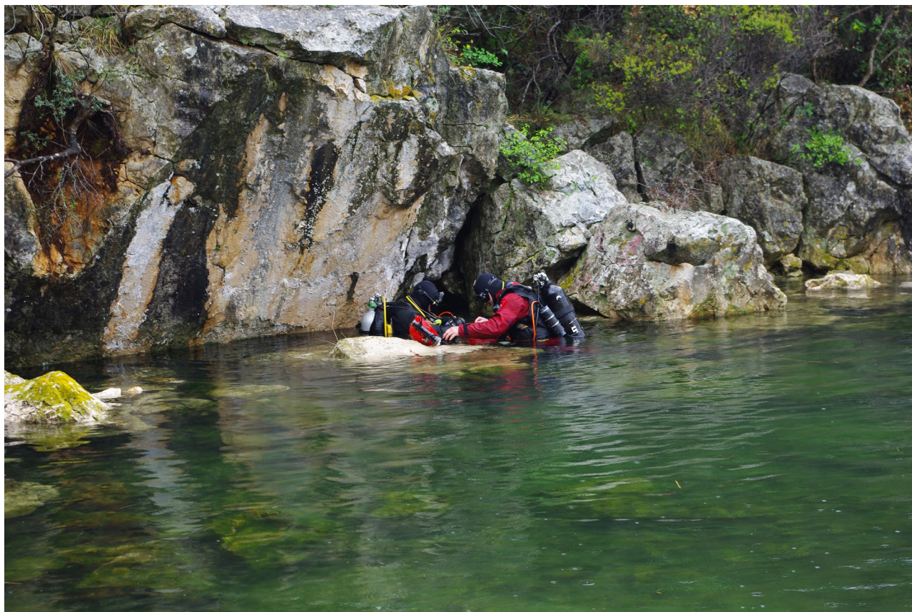
Slika 3. | Na ulazu u Špilju u uvali Vidrovača

U špilji je dobro razvijena bentoska fauna. BENTOSKE vrste naseljavaju zidove speleološkog objekta u cijelosti s naznakom da je gustoća populacija najveća na ulaznom dijelu te se udaljavanjem smanjuje. BENTOSKU faunu čine vrste fiziološki dobro prilagođene na promjenu saliniteta, koje inače naseljavaju morski i bočati vodeni okoliš te nisu karakteristične za speleološke objekte i ne pripadaju špiljskoj fauni (Tablica 1). Osim bentoskih vrsta zabilježene su i dvije vrste riba koje također ne pripadaju špiljskoj fauni. Naseljavanje i povremeni boravak netipičnih špiljskih vrsta u ovom anhidralnom