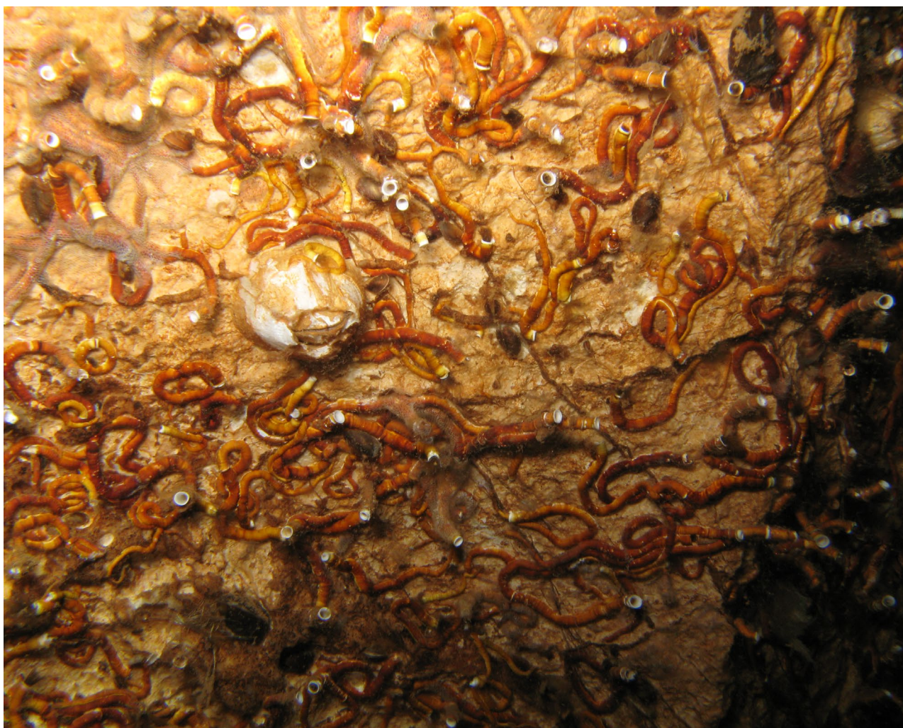
Slika 1. | Invazivna vrsta cjevaša Ficopomatus enigmaticus

Špilja u uvali Vidrovača je speleološki objekt manjih dimenzija. Ukupna dužina objekta je 42,2 m, a najveća dubina 8,7 m (Slika 4). Ulaz u špilju nalazi se ispod obalne stijene, u potpunosti je potopljen i malih dimenzija, te se je za daljnji prolaz potrebno provlačiti. Ulazni dio spušta se u dubinu od 3 m i djelomično je zarušen. Dalje se nastavlja u istom smjeru lako prolazan horizontalan kanal u dužini od 39 m. Kanal završava u manjoj dvorani s jamom u kojoj nije pronađen prolaz za dalje. Dno