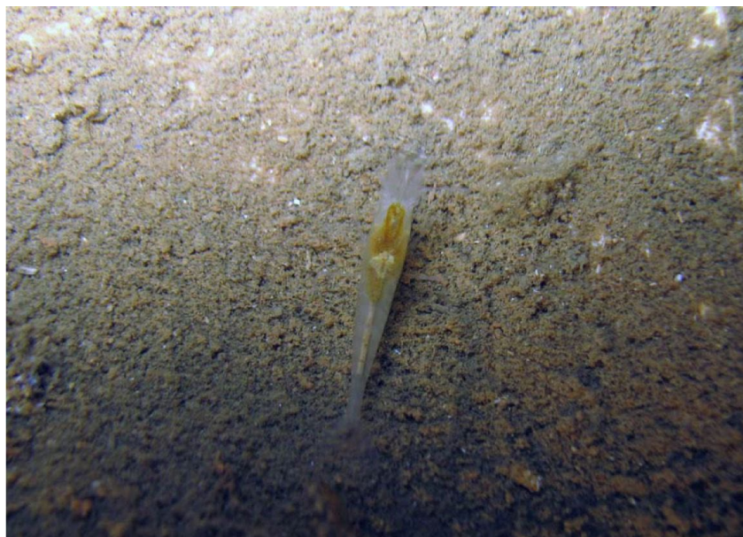
Slika 5. | Špiljska kozica Troglocaris sp.

su najvjerojatniji vektor širenja invazivne vrste cjevaša F. enigmaticus u područje estuarija rijeke Krke. Zbog povoljnih ekoloških parametara okoliša, svojim dolaskom vrsta se ubrzo proširila cijelim područjem estuarija gdje danas uz obalu stvara značajne naslage, odnosno zasebni stanišni tip Facijes s vrstom F. enigmaticus (Cukrov i sur. 2017). Istraživanjem Špilje u uvali Vidrovača potvrdila se je spoznaja da se vrsta naseljava i u anhijalnim speleološkim