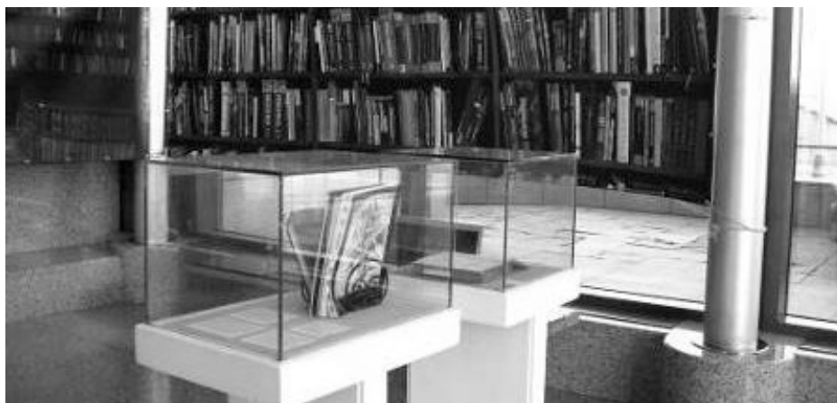
Slika 4. Prikaz dijela postava s panoramskim fotografijama na izložbi „Knjige pričaju o 100 godina Medicinskog fakulteta“ otvorenoj u Nacionalnoj i sveučilišnoj knjižnici u Zagrebu 14. prosinca 2017. godine