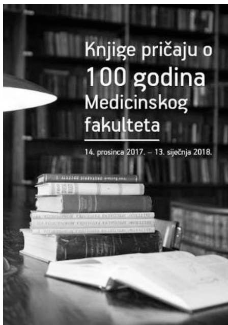
Slika 1. Najavni plakat izložbe „Knjige pričaju o 100 godina Medicinskog fakulteta“ (Nacionalna i sveučilišna knjižnica u Zagrebu, 14. 12. 2017. – 13. 1. 2018.)

Izložbom se željelo prikazati trajno nastojanje nastavnika Medicinskog fakulteta da svoje znanje i iskustvo pretoče u knjige koje će biti podrška studentima u nastavnom procesu te znanstvenicima i stručnjacima praktičarima u biomedicinskim znanostima. Nastavnici Medicinskog fakulteta rezultate svojih znanstvenih istraživanja objavljuju prije svega u časopisima, glavnom komunikacijskom putu za prijenos znanja jer je u svijetu medicine kao prirodne znanosti potreban brz protok informacija, kvalitetan postupak recenzije, ali i diseminacija tih rezultata u međunarodnu zajednicu. Međutim, uz stručni i znanstveni rad, nastavnici Fakulteta svoje su znanje dijelili s mnogim generacijama studenata medicine, budućih liječnika i svojih budućih kolega istraživača, i to u obliku monografskih publikacija – autorskih i uredničkih knjiga, prijevoda i sl.