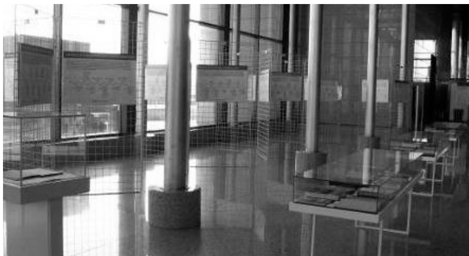
Slika 3. Prikaz dijela postava s izložbenim plakatima na izložbi „Knjige pričaju o 100 godina Medicinskog fakulteta“ otvorenoj u Nacionalnoj i sveučilišnoj knjižnici u Zagrebu 14. prosinca 2017. godine

Pri osmišljavanju plakatnih prikaza i izradi njihova tekstualnog sadržaja (tzv. interpretacijskih legendi) posebna se pozornost posvetila stvaranju vizualnog identiteta izložbe i njegova ujednačenog korištenja u svim izložbenim cjelinama. Pisanje stručnog sadržaja planiranog za izlaganje na izložbi iznimno je kompleksan proces koji uključuje pomno istraživanje kako bi se osigurala znanstvena točnost, autentičnost i utemeljenost u dostupnoj literaturi, a prilikom kojeg se mora voditi računa i o njegovu prilagođavanju potencijalnoj publici. Pratile su se smjernice za izradu tekstualnih elemenata izložbi, 43 te su se tekstovi oblikovali kao kratke bilješke, tj. kratke priče, a birane su činjenice koje bi mogle biti zanimljive i publici koja nije usko specijalizirana u predstavljenoj temi te se na umu imala i uporaba leksika u kojem se izbjegavala stručna terminologija. Tekst na plakatima bio je logički i intuitivno organiziran, kombinirao se sa slikovnim sadržajem radi veće atraktivnosti, a težilo se tomu da se fizičkim izlošcima na izložbi, tj. knjigama, pruži odgovarajući kontekst i interpretaciju koja će posjetitelje potaknuti na interakciju s izložbom. Vizualni identitet izložbe ostvaren je uporabom jedne tipografije za sav tekstualni materijal (izložbene legende, popratni izložbeni materijali: katalog izložbe, pozivnice) te ujednačenih grafičkih rješenja plakata koji su predstavljali katedre (npr. uporaba vremenske lente), uz zasebna rješenja za uvodni i završni plakat.