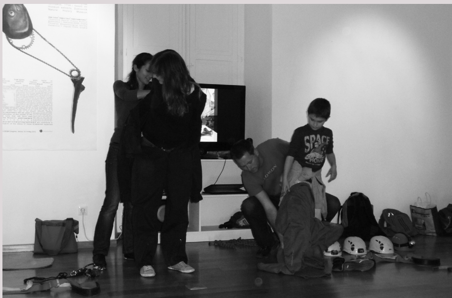
Demonstracija speleološke opreme u Muzeju

3. Prostor Prirodoslovnog muzeja Dubrovnik – kreativne radionice. U prostoru muzeja sudionici su tijekom kreativnih radionica izgradili model špilje sa špiljskim ukrasima u mjerilu 1:1 koji je predstavljao uvod u didaktičku izložbu. Model špilje nastao je kao rezultat svega zapaženog tijekom prva dva dijela radionice. Uslijedila