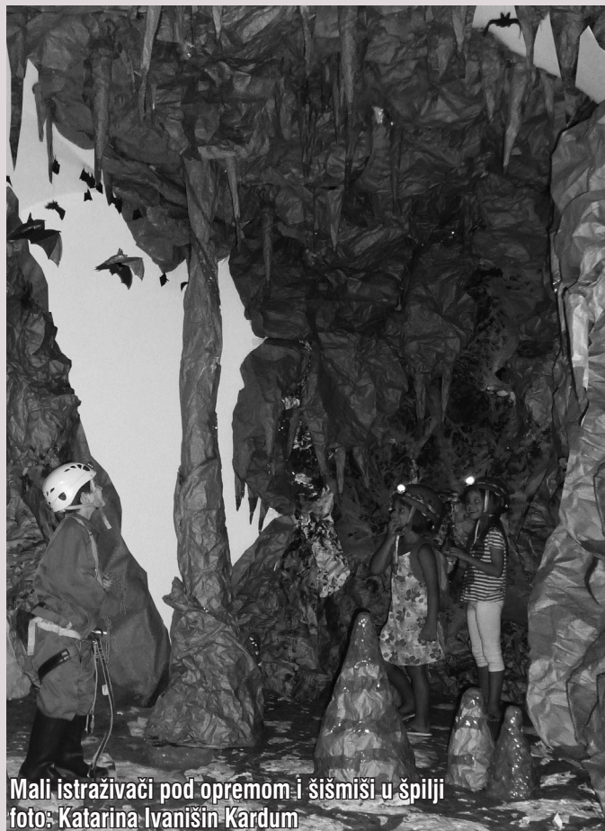
Mali istraživači pod opremom i šišmiši u špilji