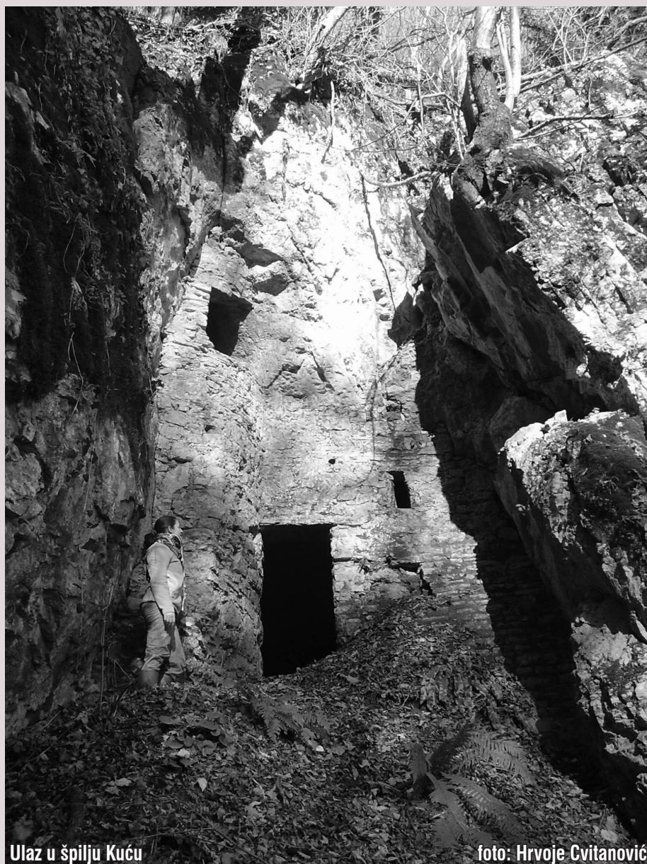
Ulaz u špilju Kuća

Skrivanje od opasnosti (od neprijatelja) u špilji je promišljen i razborit potez. Špilje ili jame često su u vrljetima, teško dostupne, ili imaju tako skrovite ili malene ulaze da ih je vrlo teško pronaći. Mjesno, civilno stanovništvo koje se boji naoružanog i snažnijeg neprijatelja ima jednu prednost: odlično poznaje okolinu. Znade uglavnom za svaku špilju ili jamu u okolini, što se uobičajeno prenosi s koljena na koljeno. Isti je slučaj i s pojedincima odmetnicima kao što su razbojnici ili hajduci: ne mogu se upustiti u borbu s brojčano i opremom i naoružanjem jačima vlastima, ali poznaju teren.