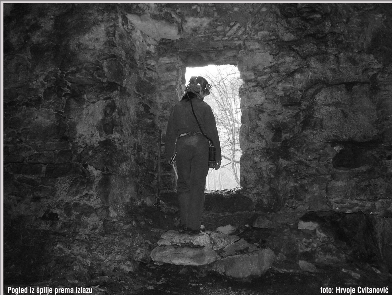
Pogled iz špilje prema izlazu