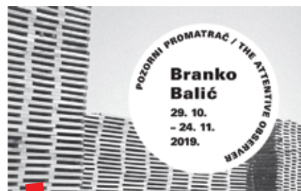
Pozivnica za izložbu „Branko Balić – pozorni promatrač“