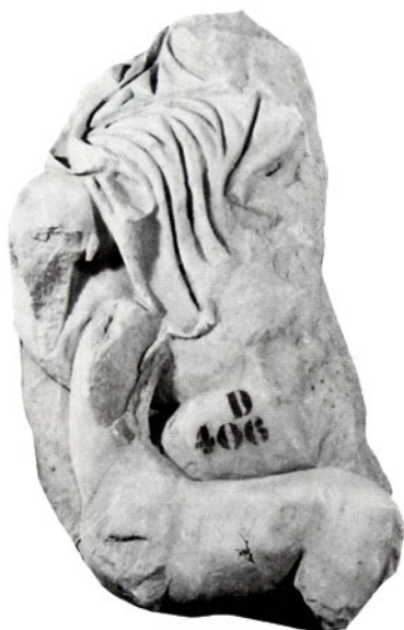
9. Fragment sanduka sarkofaga s djelomičnim prikazom psa i konja, Arheološki muzej Split (izvor: NENAD CAMBI, /bilj. 43/, 227, T. XXIII b.)

Fragment of a sarcophagus chest with a partial depiction of a dog and a horse, Archaeological Museum in Split