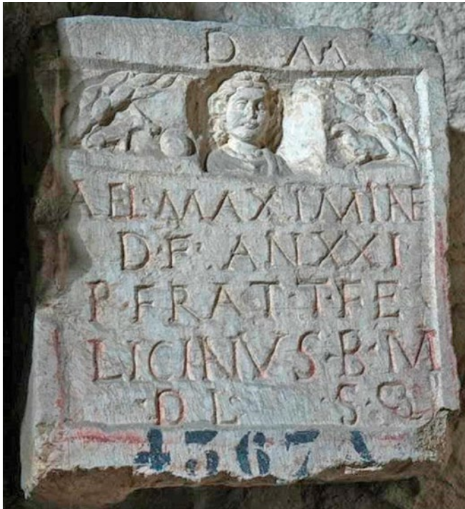
4. Stela s prikazom pokojnice, ptice i psa s loptom, Arheološki muzej Split (izvor: DRAŽEN MARŠIĆ / bilj. 26/, Tabla 15)

Stella depicting the deceased woman with a bird and a dog with a ball, Archaeological Museum in Split