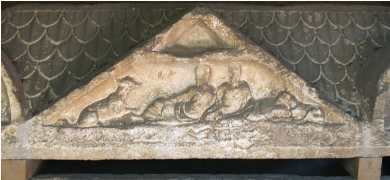
3. Poklopac sarkofaga Simplike i Kampaga, detalj s prikazom posmrtno gozbe, Arheološki muzej Split

Cover of the sarcophagus of Simplika and Kampag, detail with a depiction of funeral feasting, Archaeological Museum in Split