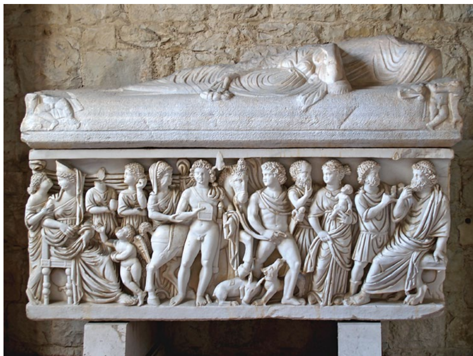
10. Sarkofag Hipolita i Fedre, Arheološki muzej Split

Jedan od takvih spomenika, datiran u početak 4. stoljeća, jest sarkofag koji je na salonitansku nekropolu stigao kao import iz klesarskih radionica grada Rima (sl. 10). 49 Mramorna klina, odnosno poklopac sarkofaga sadrži prikaz ležećih pokojnika, dok prednja strana sanduka sadrži scenu iz mita o Hipolitu. Podno središnje figure Hipolita prikazana su dva lovačka psa, jedan s glavom okrenutom prema tlu, koji grize ili liže prednju nogu ili neki objekt, dok drugi Hipolitu liže nogu.