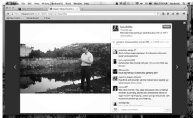
Gambar 2. Ahok dalam Inspeksi Mendadak di Instagram

Penampilan Ahok yang seperti itu menciptakan reputasi pemimpin yang tanggap dan mempunyai estetika yang baik. Penampilan yang selalu rapi memperlihatkan juga kepercayaan diri yang baik dan pemimpin yang berkredibilitas. Dalam foto yang tampak, pemimpin yang cerdas, mempunyai kepercayaan diri, jujur, determinatif terbukti pada gambar latar di belakangnya yang sedang menyidak lingkungan di DKI, dan interaktif selalu berkomunikasi dengan bawahan dan masyarakat dalam arti siap menerima informasi apa pun.