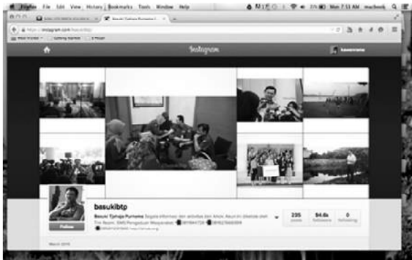
Gambar 1. Instagram @basukibtp

diharapkan dibentuk. Visualisasi ini dianalisa menggunakan teori Dramaturgi menjelaskan bahwa identitas manusia adalah tidak stabil dan setiap identitas itu merupakan bagian kejiwaan psikologi yang mandiri. Identitas manusia bisa saja berubah-ubah tergantung interaksi dari orang lain. Disinilah Dramaturgi masuk, bagaimana kita menguasai interaksi tersebut. Dalam dramaturgi, interaksi sosial dimaknai sama dengan pertunjukan teater. Manusia adalah aktor yang berusaha untuk menggabungkan karakteristik personal dan tujuan kepada orang lain melalui pertunjukan dramanya sendiri. Dengan konsep teori dramaturgi dan permainan peran yang dilakukan oleh manusia, terciptalah suasana- suasana dan kondisi interaksi yang memberikan makna tersendiri. Munculnya pemaknaan ini sangat tergantung pada latar belakang sosial masyarakat itu sendiri. Dramaturgi dianggap masuk kedalam perspektif obyektif karena teori ini cenderung melihat manusia sebagai makhluk pasif. Meskipun pada awal ingin memasuki peran tertentu manusia memiliki kemampuan untuk subyektif atau kemampuan untuk memilih, namun pada saat menjalankan peran tersebut manusia berlaku obyektif, berlaku natural, mengikuti alur. Ahok sebagai individu yang meledak-ledak tergambarkan sebagai sosok yang ramah dan sangat bersahaja, dalam foto instagram Ahok berusaha untuk menggabungkan karakteristik personal dan tujuan kepada orang lain.