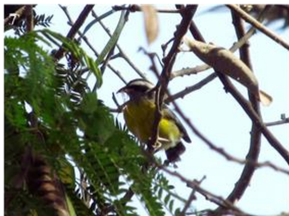
Lámina IV. Familias Trochilidae, Apodidae, Fringilidae e Hirundidae.