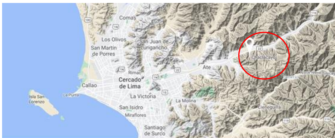
Fig. 1. Mapa. Ubicación de la zona de estudio en el ámbito del valle del río Rímac.

La localidad del estudio es el distrito de Chaclacayo, que se ubica al este y en la provincia de Lima, a unos 660 Km de la capital; limitado en su extremo norte por el Valle del Río Rímac, al este por el distrito de Chosica, al sur por el distrito de Cieneguilla, y al oeste, por el distrito de Ñaña. La zona es conocida por su clima bastante diferenciado en dos estaciones bien definidas, una húmeda entre noviembre y abril, y otra seca entre mayo y octubre, teniendo la presencia de las especies en su mayoría, en todo el año (Fig. 1). La mayor parte de la vegetación en la ciudad, es exótica, a pesar de ello, se encuentran algunas zonas con el manto vegetal nativo, lo que atrae a gran número de invertebrados que son parte de la alimentación de los dinosaurios avianos actuales.