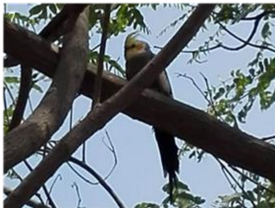
Lámina III. Familias Columbidae y Psittacidae. (Fotos R. Guzmán P.).