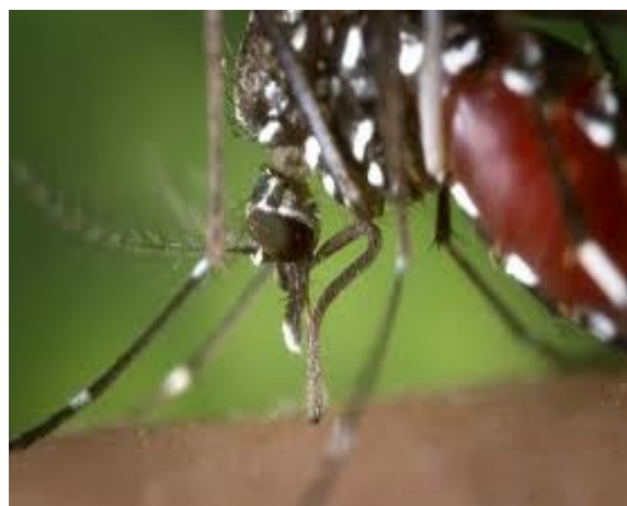
Gambar 5. Nyamuk Aedes albopictus sebelum dan sesudah menghisap darah