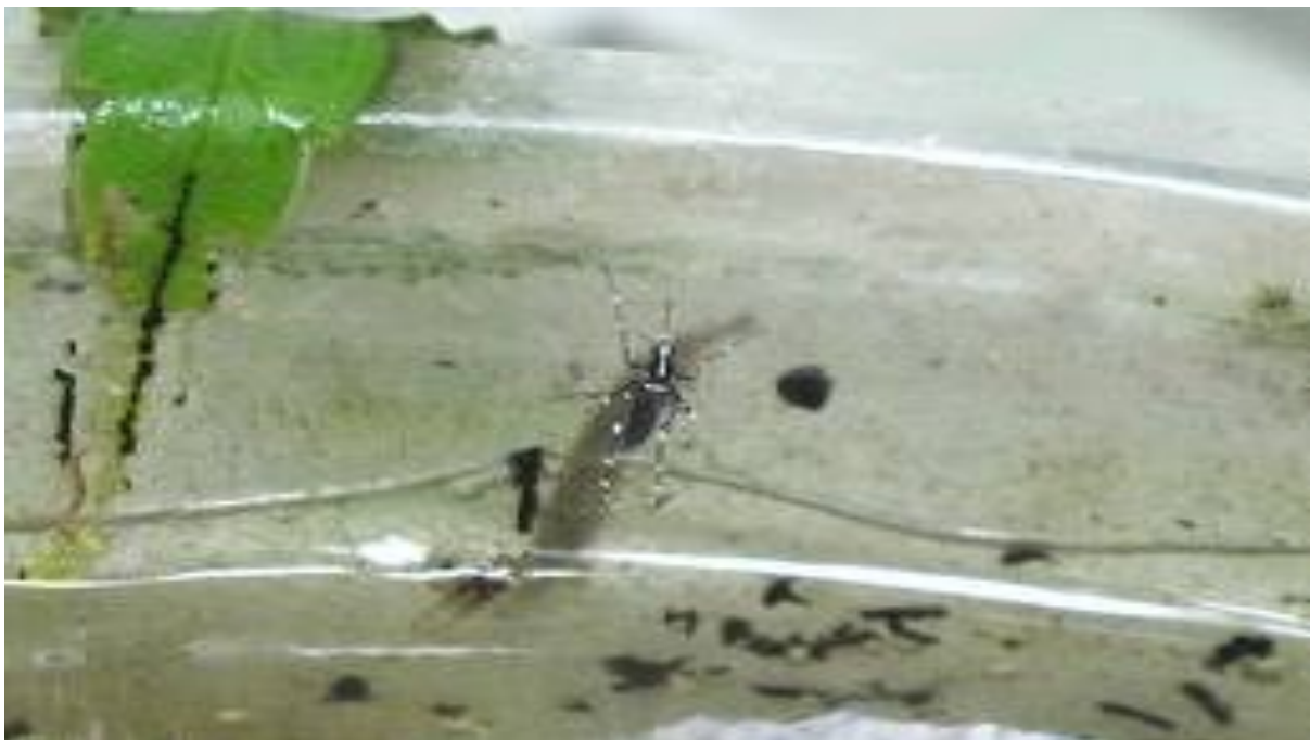
Gambar 3. Tempat perkembangbiakan nyamuk Aedes albopictus

Kehidupan nyamuk Ae. albopictus dimulai dari telur yang diletakkan pada dinding dekat permukaan air. Perletakan dapat terjadi kira-kira 4 sampai 5 hari