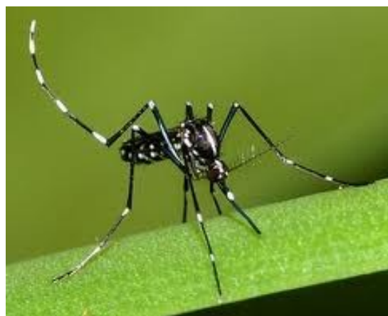
Gambar 2. Nyamuk Aedes albopictus stadium telur, larva, kepompong dan dewasa