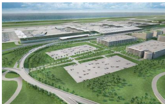
Gambar 1 Desain terminal YIA

Bandar Udara Internasional Yogyakarta (YIA) terletak di Kecamatan Temon, Kabupaten Kulon Progo, Provinsi Daerah Istimewa Yogyakarta dengan koordinat runway bandar udara pada koordinat geografis 70°54'39.20 "Lintang Selatan dan 110°4'21.11 "BT atau di bandara koordinat X = 18.400 meter dan Y = 20.080 meter di mana sumbu X bertepatan dengan sumbu landasan pacu yang memiliki azimuth geografis 290 ° 0 '0 "dan sumbu Y yang melewati ujung runway 29 tegak lurus dengan sumbu X. Luas lahan untuk kebutuhan pembangunan bandara baru di Kabupaten Kulon Progo adalah 634 Ha. Lebih jelas perhatikan gambar berikut.