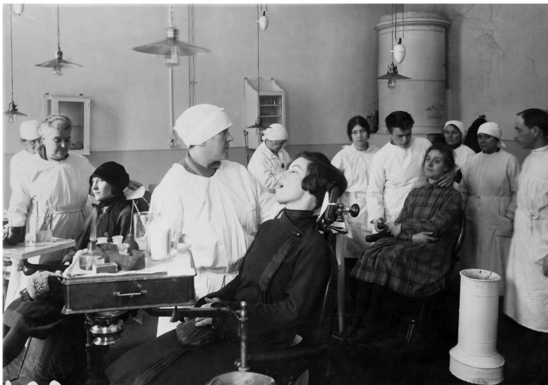
Занятия по одонтологии в Ленинградском медицинском институте в 1920-х гг. (Центральный государственный архив кинофотофонодокументов Санкт-Петербурга) Odontology classes at the Leningrad Medical Institute in the 1920s (Saint Petersburg Central State Archive of Film and Photographic Documents)