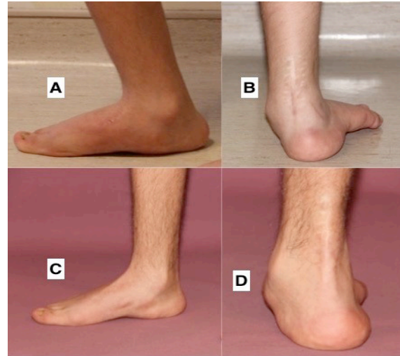
Şekil 3. A–D. Pes kalkaneus deformitesi olan hastanın klinik görüntüleri sunulmuştur. Ameliyat öncesi görüntülerinde ayakta dururken ayak bileğindeki aşırı dorsifleksiyon dikkat çekmektedir (A, B). Tedavi sonrası düzelmiş klinik fotoğraflarında ise hasta ayakta iken ayağın nötral diziliminin sağlandığı görülmektedir (C, D).

Ameliyat öncesi hastaların ayaklarının muayenelerinde medial longitudinal kavsin düzleştiği ve ön ayağın laterale yöneldiği tüm hastalarda görülmüştür. Hastaların çoğunda da ayak medialinde bir nasırlaşma gözlenmiştir (Şekil 3). Tüm hastalar ameliyat öncesinde orteز kullanmaktaydı.