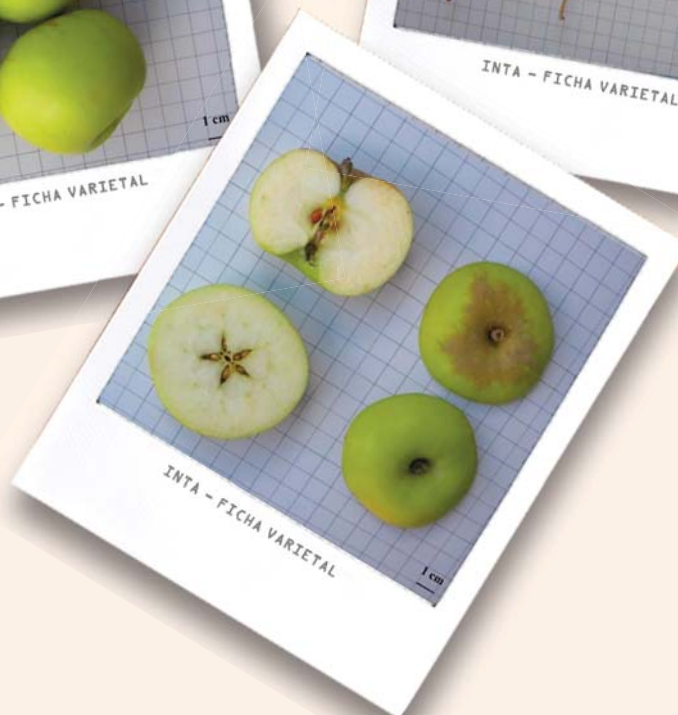
INTA - FICHA VARIETAL