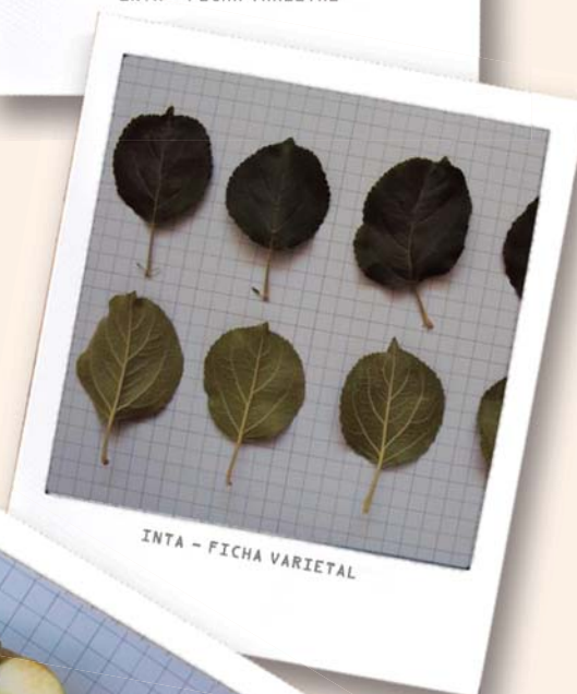
INTA - FICHA VARIETAL