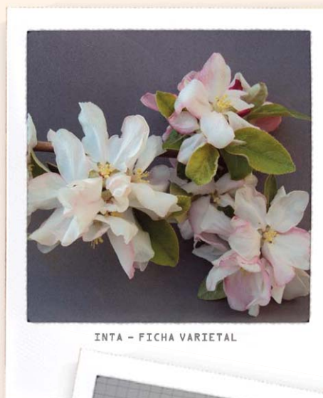
INTA - FICHA VARIETAL