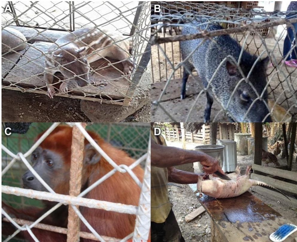
Figura 2. Registro fotográfico de las especies presentes y de uso en las localidades de Aguas Blancas y Chimborazo en los municipios de Los Córdoba y Canalete, Córdoba, Colombia. A) Guartinaja ( Cuniculus paca ) en cautiverio, B) Zaino ( Pecari tajacu ) en cautiverio, C) Mono colorado ( Alouatta seniculus ) en cautiverio, D) preparación de armadillo ( Dasypus novemcinctus ).

En la localidad de El Chimborazo no se evidencia la comercialización de fauna silvestre, debido a que las especies se encuentran protegidas por los dueños de predios con fragmentos de bosque, actuando como guardabosques. Sin embargo, se presenta la cacería de control de especies que pueden generar daños a cultivos y especies domésticas, como es el caso de la zorra chucha ( Didelphis marsupialis ) y algunos carnívoros, como son la zorra baya ( Cerdocyon thous ) y la zorra tejón ( Procyon cancrivorus ).