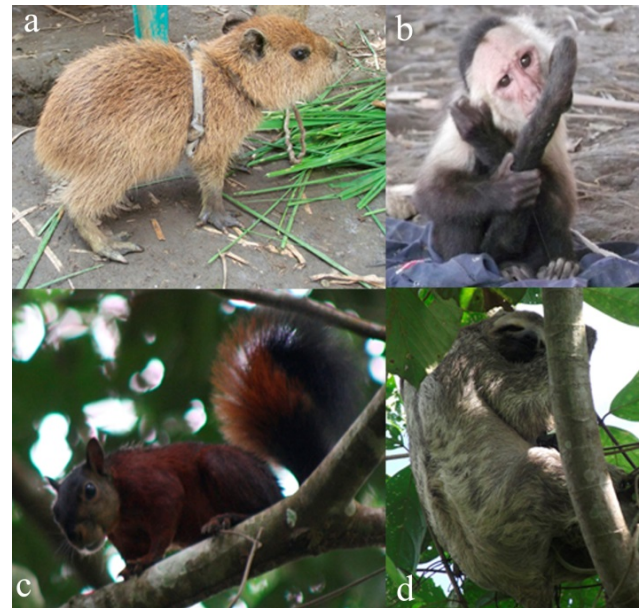
Figura 2. Algunos mamíferos presentes durante la caracterización ambiental de La Baja y Media Mojana entre el 2011 y el 2012, en los departamentos de Sucre, Bolívar y Córdoba, Colombia. a) Juvenil de ponche ( Hydrochoerus isthmius ), b) Mico cara blanca ( Cebus capucinus ) mantenidos como mascotas en la vereda el Chopal y, c) Ardilla roja ( Sciurus granatensis ) y d) Perico ligero ( Bradypus variegatus ) especies comunes en los relictos de vegetación presentes en la zona.