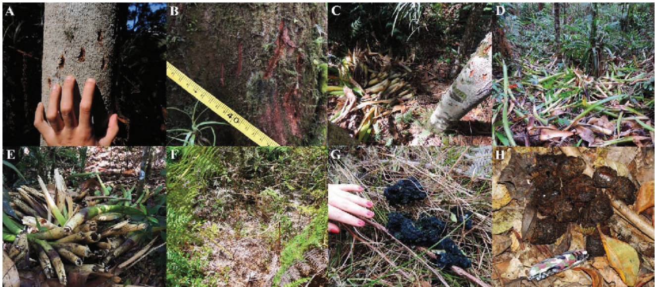
Figura 2. Rastros de Oso Andino encontrados en la Reserva Natural El Páramo-La Floresta. Rasguños (A, B); Comedero y bromelias consumidas (C, D, E); Sendero en helechal (F); heces secas (G) y frescas (H).

Estos registros resaltan la presencia actual de la especie en un área protegida, la cual presenta relictos de robledales ( Quercus humboldtii ) con abundantes epífitas, en una matriz de zonas abiertas con helechales y pastizales de subpáramo (con más de 10 años de regeneración) anteriormente dedicados a ganadería. En zonas abiertas de la reserva se encuentran matorrales de Puya killipii Cuatrec. que eventualmente podría ofrecer alimento a la especie, como en el caso de P. antioquiensis en el páramo del Sol, en Urrao, Antioquia (Natalia Delgado com. pers.). Igualmente hay presencia de rosetas de palma de cera ( Ceroxylon quindiuense y C. vogelianum ) pero sin evidencia de consumo. Figueroa & Stucchi (2013) reportan el consumo de C. parvifrons por parte del Oso Andino en Perú.