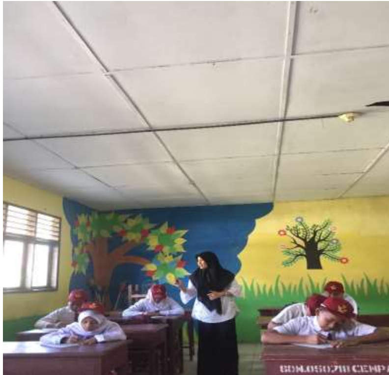
Gambar 3.1 Penjelasan Mengenai Cara Pengisian LJK