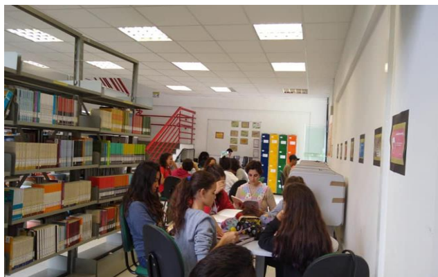
Figura 1: Alunos na Biblioteca

O presente resumo apresenta apenas resultados parciais sobre este projeto extensão. Pode-se destacar a aproximação da Escola Básica Municipal João Germano do IFC-Campus São Francisco do Sul, o engajamento dos bolsistas e o conhecimento de outras práticas de ensino, como por exemplo, as desenvolvidas pela Escola da Ponte e pela Escola Municipal de Ensino Fundamental Desembargador Amarin Lima. Segue algumas imagens das atividades realizadas, as Figuras 1 e 2 mostram os bolsistas acompanhando os estudantes da Escola Básica Municipal João Germano Machado na Biblioteca e no Laboratório de informática: