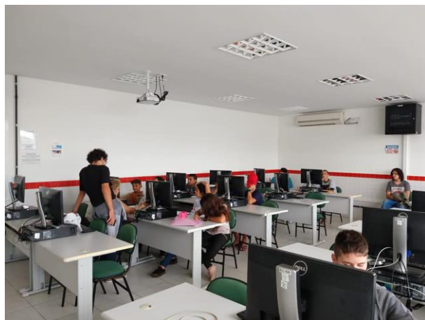
Figura 2: Alunos na biblioteca