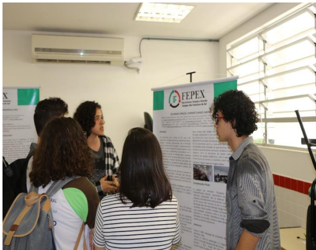
Figura 3: Apresentação na VII FEPEX (bolsistas apresentando o banner do trabalho)

Pode-se destacar que este trabalho foi premiado na VII FEPEX, na modalidade Extensão, Ensino Médio. Sendo que, tal premiação incentivou ainda mais o trabalho da equipe envolvida, abaixo segue imagens da apresentação dos alunos e do ato de premiação, Figura 3- Apresentação na VII FEPEX e , Figura 4- Ato de premiação da FEPEX (Representante da Comissão e bolsista):