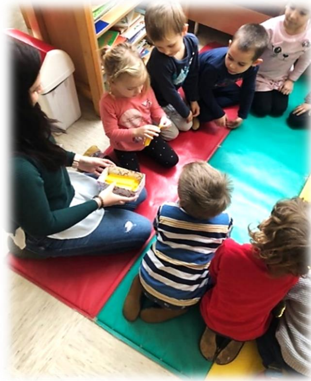
Slika 21: Žrebanje naslova filma

Deklica D je spontano predlagala naslov filma, ki naj bi se glasil: Grajski dan igrač. Izhajala je iz tega, da smo Vrtec pod gradom, v našem grbu pa je grad – to je razložila tudi ostalim. Vsem otrokom je bil naslov všeč, zato smo ga soglasno potrdili.