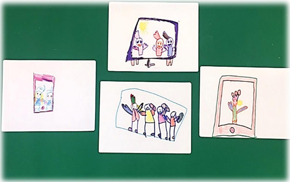
Slika 1: Predstave otrok, kje lahko dobijo film

Otrokom proces nastajanja filma od prej ni bil znan, njihovi opisi so bili skromni, najpogostejši odgovor je bil: »Film se posname s kamero.« Vedeli so, da v filmu igrajo igralci, ostalih poklicev niso znali poimenovati. Veliko več so vedeli o tem, kje film lahko dobijo. Najpogostejši odgovori so bili: telefon, televizija, trgovina, računalnik in kino. Otroci so svoje predstave tudi narisali.