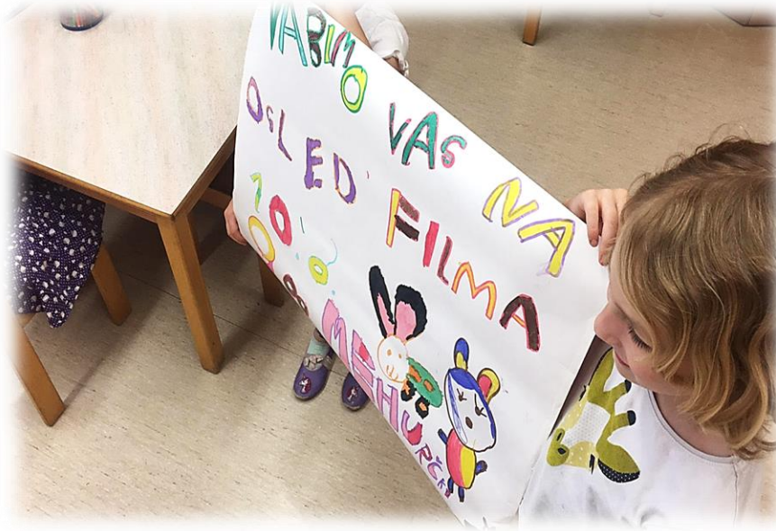
Slika 24: Predstavitev vabila po igralnicah