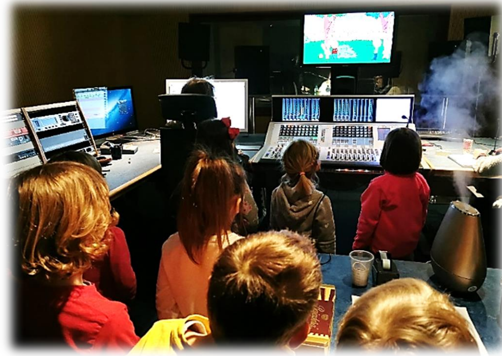
Slika 13: Ogléd risanke Simon