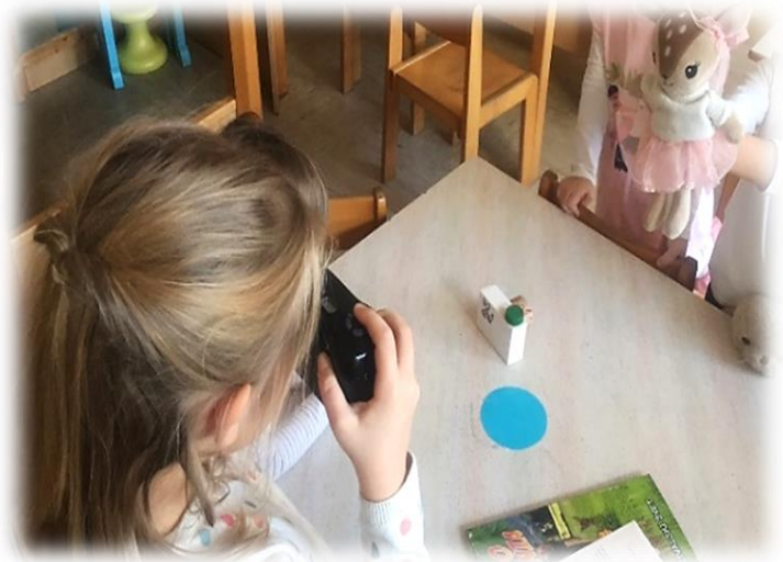
Slika 18: Snemanje prijateljice