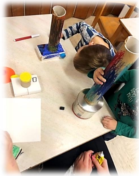
Slika 15: Izdelava kamer

Nekaj otrok je naslednji dan prineslo odpadni material, nekaj pa smo ga skupaj poiskali v našem vrtcu. Iz odpadnega materiala: škatlice zdravil, zamaški, kartoni, škatle ter pripomočkov, ki so si jih izbrali otroci (škarje, lepilo, barvice, flumastri), so nastale čudovite kamere. Otrokom sem pomagala pri lepljenju ter rezanju tulcev. Prosili so me za pomoč, ker so bili nekateri tulci pretrdi, da bi jih lahko rezali sami.