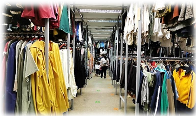
Slika 7: Garderoba RTV-ja

Katja nas je nato peljala do garderobe, kjer delo opravljajo šivilje ter kostumografinje, v njej pa je približno 70000 oblek in kostumov za različne priložnosti. Z njimi oblečejo nastopajoče, ki jih lahko vidimo po televiziji. Otroci so se čudili, kako veliko oblek ima ta »hiša«. Deklicam so bile všeč obleke, polne bleščic, dečki pa so se bolj navduševali nad vojaškimi uniformami ter čeladami. Zanimalo jih je tudi, ali so bile že vse obleke nošene in ali jih morajo ljudje, ki jih nosijo, kupiti, preden jih oblečejo. Katja jim je razložila, da jih ni potrebno kupiti, saj so obleke namenjene večkratnim priložnostim. Deklica A je vprašala, ali si lahko tudi oni izposodijo obleke. Žal je bil odgovor negativen, saj jih ne smejo posojati izven »hiše«.