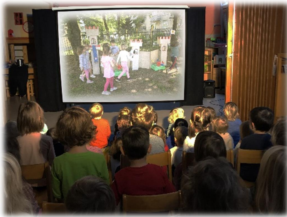
Slika 25: Premiera filma na platnu

sem vprašala o njihovih vtisih ob gledanju filma, kakšna se jim je zdela zgodba, ali bi kaj dodali/spremenili, kako bi se zgodba še lahko končala, ali so vedno le srečni konci zgodbe, kakšni se še lahko zgodbe zaključijo. Nato sem otroke povabila, da Mehurčkom postavijo vprašanja v zvezi s filmom ter njihovim snemanjem.