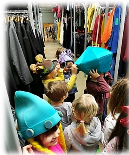
Slika 9: Preizkušanje vojaških čelad