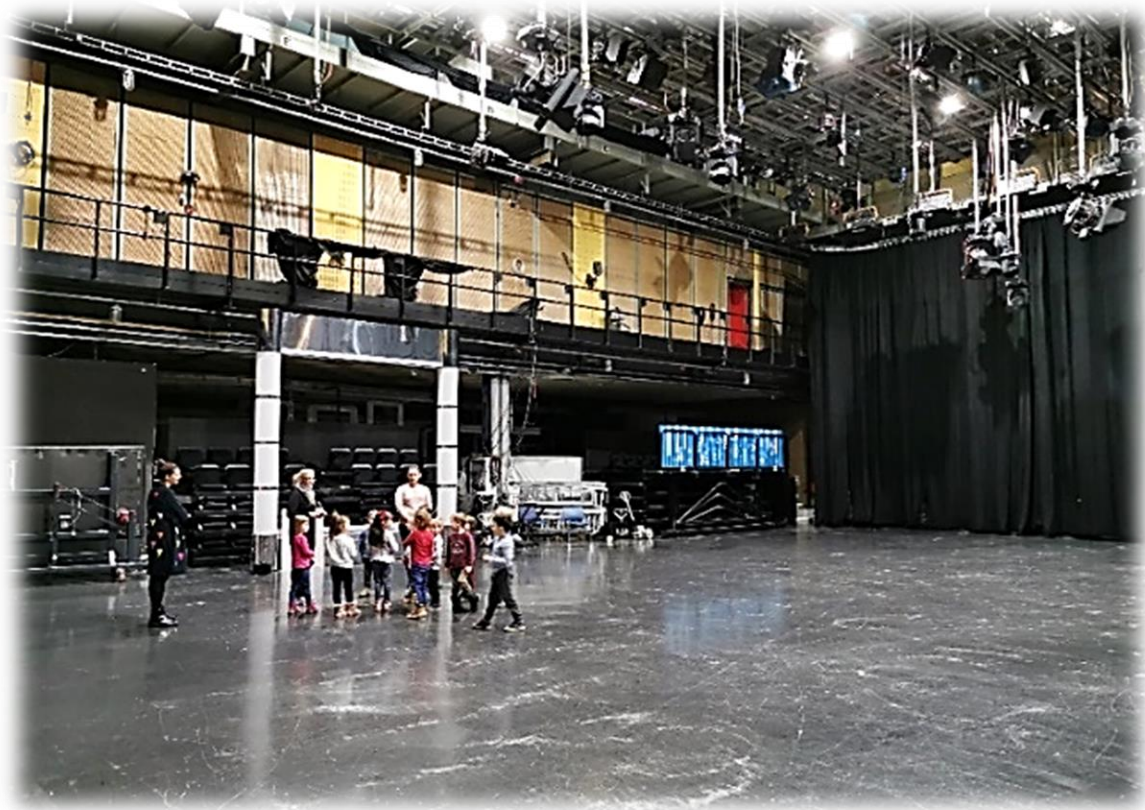
Slika 10: Studio 1