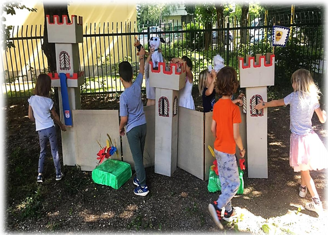
Slika 23: Igranje in snemanje filma

Na dan snemanja smo najprej pripravili sceno, ki smo jo uporabili že pri nastopanju Godrnjavčka (cvetlice, drevesa), ter grad, ki je maskota vrtca. Ker v vrtcu nimamo dovolj prostora, smo sceno postavili na vrtčevskem igrišču. Z vzgojiteljico sva postavili težje rekvizite (grad), otroci pa so pomagali pri manjših (drevesa, cvetlice).