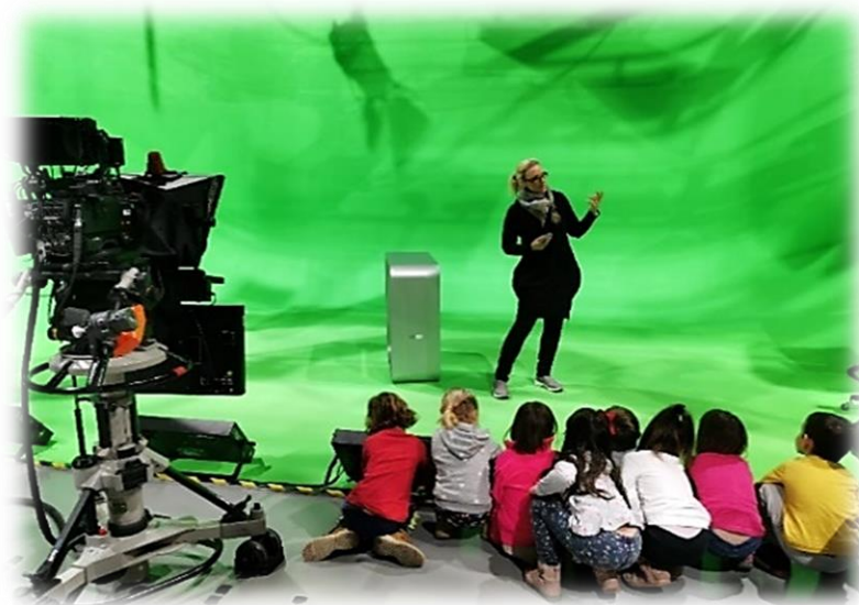
Slika 12: Studio, kjer snemajo vremensko napoved