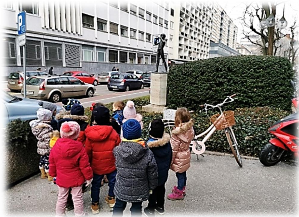
Slika 14: Mehurčki pred RTV-jem

naslednji dan pogovarjali o tem, kaj jim je bilo na ogledu najbolj všeč, se je večina odgovorov nanašala na kamere ter risanko, ki so si jo ogledali na koncu.