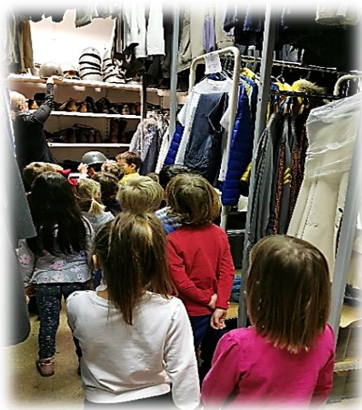
Slika 8: Preizkušanje klobukov