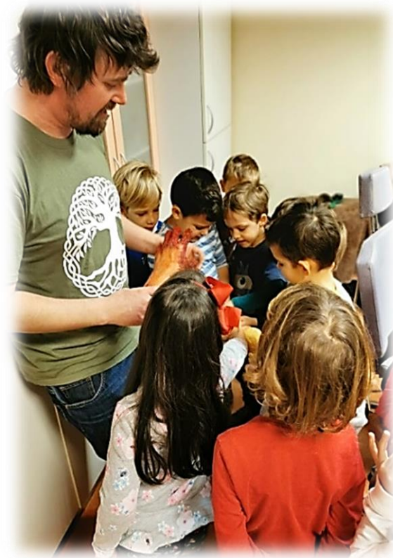
Slika 6: Ogled rekvizita »krvave roke«