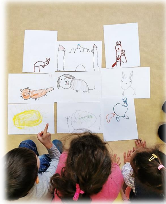
Slika 22: Snemalni načrt v zaporedju dogodkov