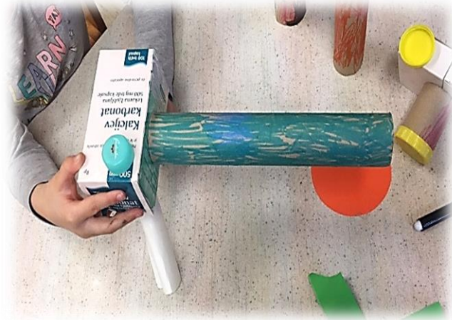
Slika 16: Kamera

Naslednje jutro so me nestrpno spraševali, ali so kamere že suhe, saj so si želeli igrati z njimi. Deklica S je od doma prinesla nekaj starih, nedelujočih fotoaparatorov ter eno kamero. Ponosno je povedala, da je vse to sedaj lahko vrtčevsko. Otroci so bili navdušeni. Skoraj celo dopoldne so se igrali, da snemajo. Snemali so ljudi, ki so hodili mimo vrtca, drug drugega, stvari v igralnici, svoje igrače, celo mene. Vmes je potekal zanimiv pogovor, predvsem deklic, ki so »pozirale« pred objektivom. Druga drugi so govorile, kako naj se postavijo in kako smejijo.