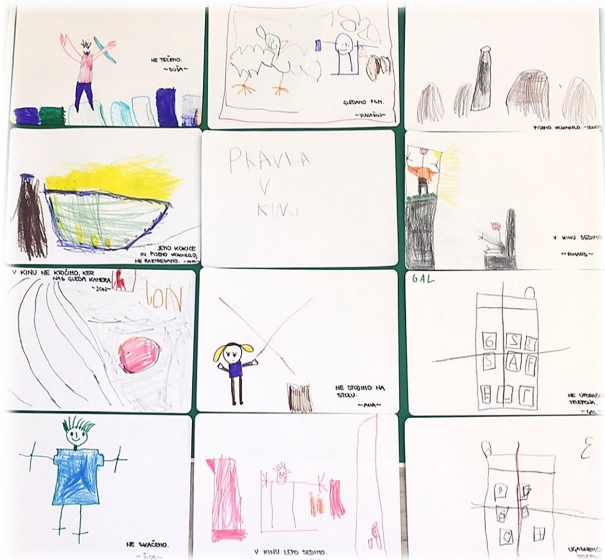
Slika 20: Plakat pravil vedenja v kinu