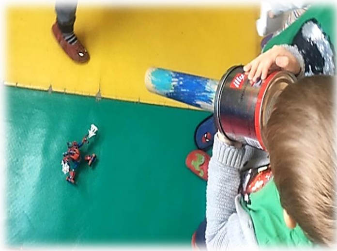
Slika 17: Snemanje domačih igrac