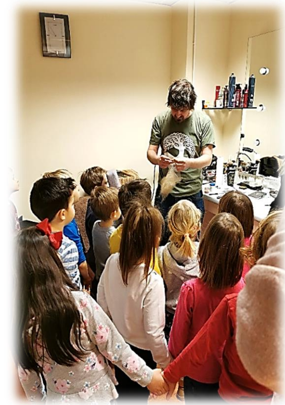
Slika 5: Ogled umetne brade in brkov