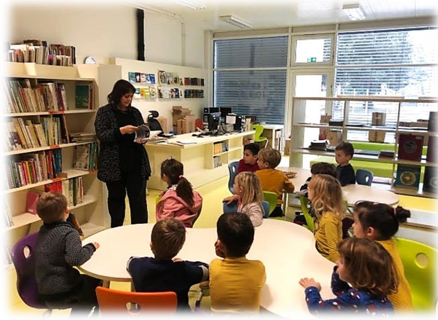
Slika 19: Obisk knjižnice