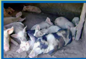
Febre alta e amontoam-se num canto da pocilga