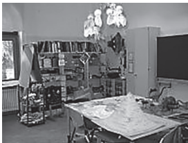
Die Lernwerkstatt ist ein Markenzeichen der Brixner Ausbildung