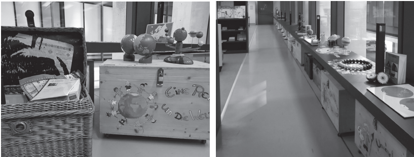
Abb. 3: Themenkisten aus der Anfangszeit in der EduSpace Lernwerkstatt

Ermöglicht wurde diese vielfältige Arbeit durch eine großzügige personelle Ausstattung mit einer abgeordneten Lehrkraft als ständiger pädagogischer Mitarbeiterin und einer studentischen, wissenschaftlichen Mitarbeiterin unter der wissenschaftlichen Leitung des Ordinarius für Allgemeine Didaktik, d. h. es wurden ausreichende personelle und finanzielle Ressourcen zur Verfügung gestellt und in den Etat der Fakultät eingeplant. Daran zeigt sich auch das Interesse der Schülämter und der Südtiroler Bildungspolitik, am Standort Brixen eine Lehrerbildung aufzubauen, mit für die Region und das Land Italien neuen Elementen (siehe WIATER 2008). Entsprechend groß war die Resonanz in der Südtiroler Presse.