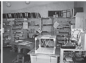
Auch Kindergruppen und Schulklassen nutzen das Lernangebot

( http://www.schule.provinz.bz.it/forum-schule-heute/2008_2/2008_2_Wiater.htm [23/01/2020])