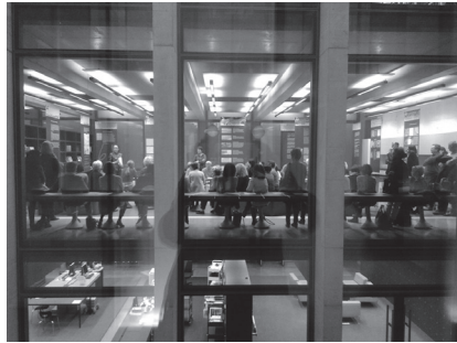
(© Karlics 2017)