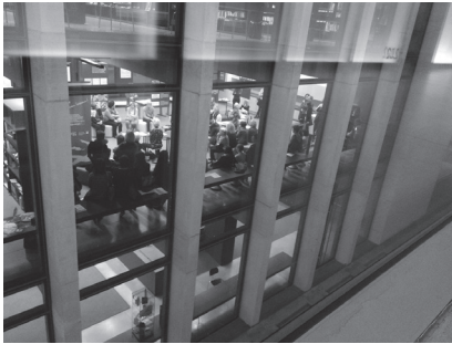
(© Karlics 2017)

Diese Sichtbarkeit nach innen und außen verdankt insbesondere die EduSpace Lernwerkstatt ihrem Umzug vom Nebengebäude in das Fakultätsgebäude in einen zentralen und transparenten Raum im ersten Stock der Universitätsbibliothek (Abb. 4).