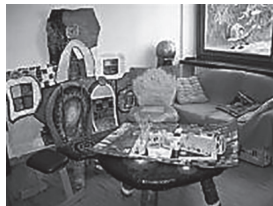
Hier wird theoretisch und praktisch zum Lernen von Kindern geforscht