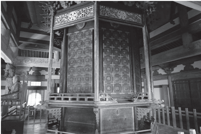
【図版2】祖院経蔵内輪蔵