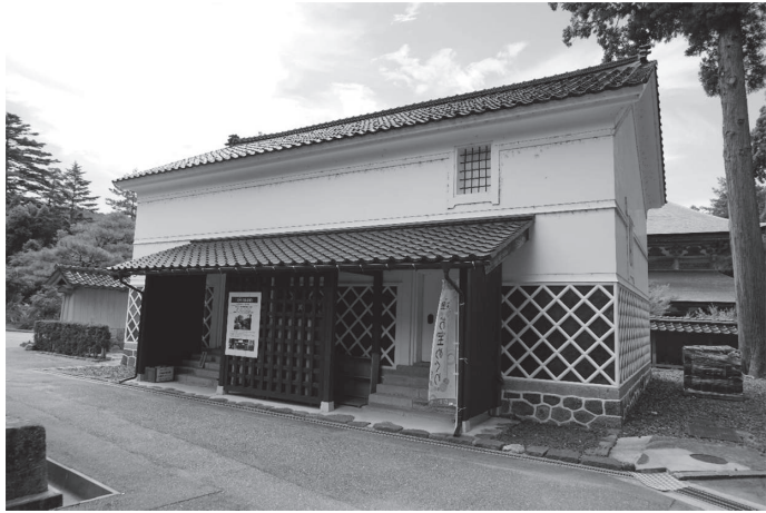
【図版3】祖院白山藏外観