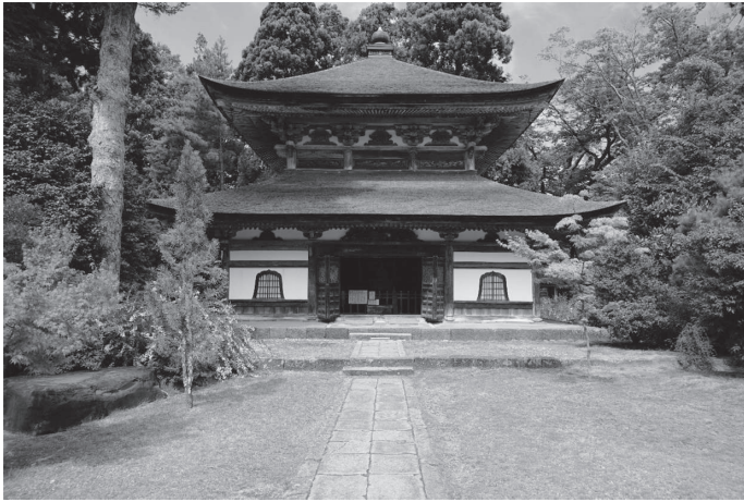
【図版1】祖院経蔵外観