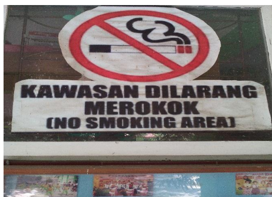
Gambar 2. Mading MI tertera stiker Bebas Rokok