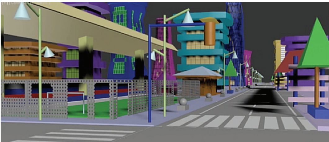
Gráfico 2. Trabajo realizado por un alumno durante el periodo lectivo Septiembre 2013-Febrero 2014

Con esta respuesta favorable, en el siguiente periodo lectivo los videos generados fueron entregados a los alumnos para ser revisados las veces necesarias, a partir de lo cual se realizó la segunda encuesta en un grupo pequeño de estudiantes que cursaron la asignatura de Expresión Digital (alumnos que tuvieron clases con la metodología en vigencia en la Facultad y otros que trabajaron con los videos propuestos), se obtuvieron comentarios como: “nos ayuda a repasar y a consultar dudas en cualquier momento no necesariamente estando en clases” , lo que facilita un aprendizaje autónomo e independiente de temas académicos (Erazo & Sánchez, 2013).