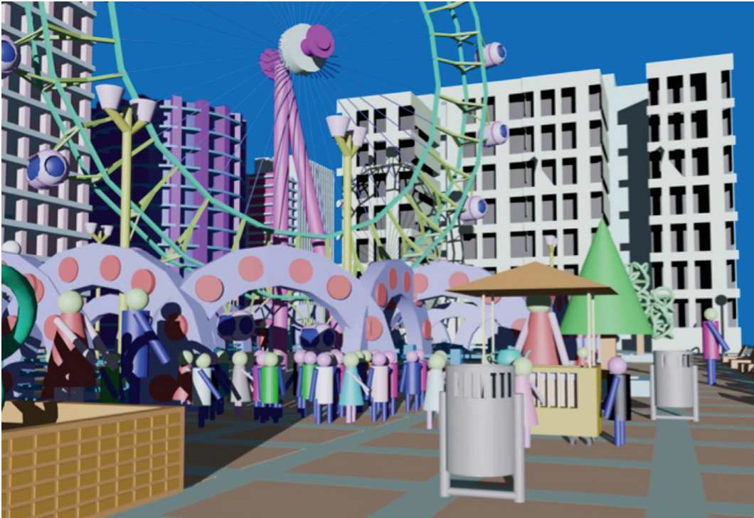
Gráfico 1. Trabajo realizado por un alumno durante el periodo lectivo Septiembre 2011-Febrero 2012